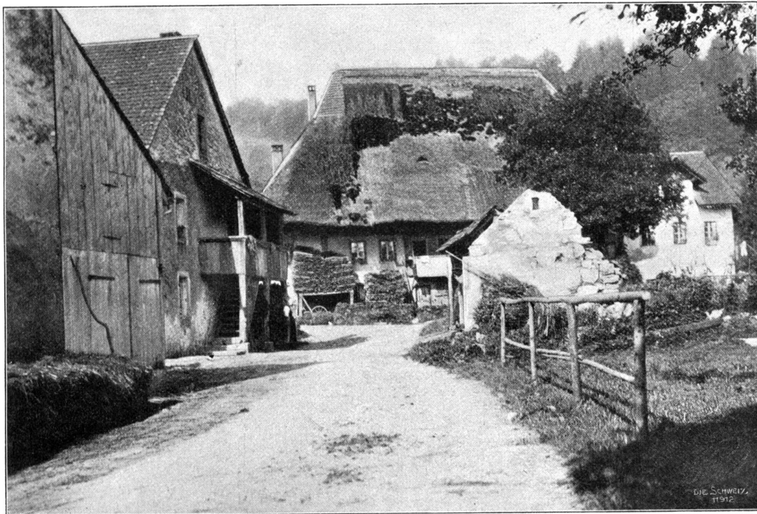
Partie aus der Au bei Auenstein (1898).

Gleiche Aufmerksamkeit wie die Lateinschule erfuhr das Rathaus (neben dem Schwarzen Turm), das mit den Medaillen-Bildnissen berühmter Bürger geschmückt ist. Die schöne, steinerne Brücke, die in einem Bogen über den wogenden Fluß fest und einen freien Blick auf eine wunderbar geschlossene Stromlandschaft gewährt, wird immer von neuem gesichert. Das Licht, das mit diesem Flusse ins Städtchen hineinzieht, spiegelt sich auch heute noch in dem hellen Geiste seiner Bewohner. Brugg ist eines der ersten Städtchen, das ein Elektrizitätswerk auf Gemeindefosten angelegt hat. Dieses hat nun den industriellen Geist erfolgreich geweckt. Wegen seiner zentralen Lage ist es auch der Sitz der kantonalen landwirtschaftlichen Winterschule geworden, während die Wasserverhältnisse es zum eid-