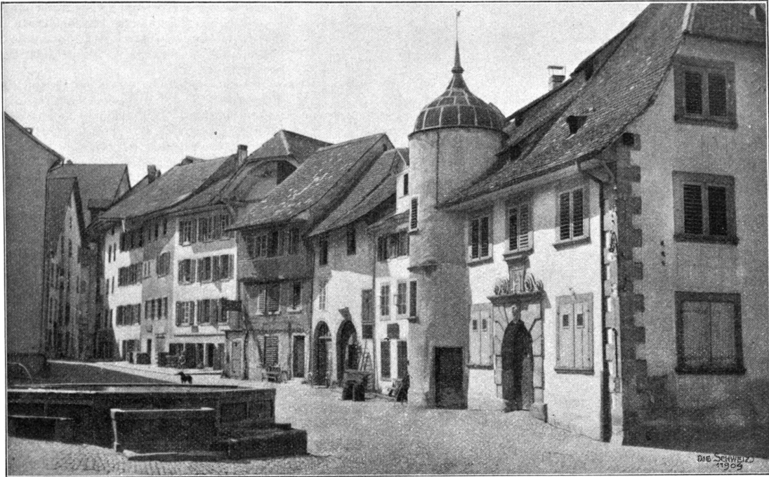
Brugg: Partie aus der Hofstatt (1898).