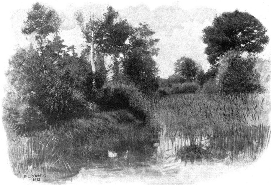
Studie aus dem Schachen bei Auenstein.

Wie dort gibt es auch hier Erfrischungen; noch etwas weiter, auf Stalden, einer alten Umspann-Station, finden große Gesellschaften Unterkunft. Aber man braucht eigentlich so weit nicht zu gehen: Der nahe Bruggerberg mit seinen sich gemach am Hügel hinwindenden Schattengewegen, die da und dort in behagliche Fest- und Fernsichtsplätze einmünden (Nieteid, Heyenplatz, Hansfluh, Bruderhaus — wo die Brugger ihre Kindlein herholen —, Kegelplatz etc.) gestattet neben schönen Spaziergängen im einsamen Sidwald schon einen ganz prächtigen Ausblick in die Alpen, der im Vordergrund links vom Gebenstorfer Horn mit dem von grüner Terrasse aufragenden, hellleuchtenden Kirchen-Geschwisterpaar und rechts vom Wülpels- und Stefenberg mit den Schlössern Habsburg und Brunegg flankiert wird; zudem hat man eine Thallandschaft von eigenartigem Reiz vor sich: Links in der Tiefe das industrielle Windisch, dessen Baumwollspinnereien gegen zweitausend Hände beschäftigten, zu Füßen das idyllische Städtchen, dessen älterem Teil ein gewisser romantischer Charakter nicht abzuspüren ist. Auf der breiten Thalsohle zwischen dem Wülpelsberg mit der Ruine Habsburg einer- und dem Bögberg anderseits wälzt von Westen her in kräftigen Bindungen die Aare ihre weißglänzenden Wogen, die grünen Tannen-