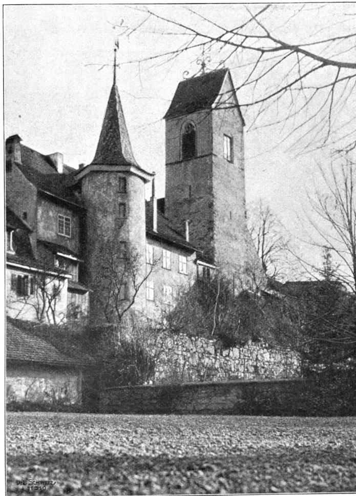
Kirche und Schulhaus in Brugg.

Um diese Zeit wird auch die große Heerstraße wieder sicher geworden sein, die von Zürich über Brugg nach Basel führte und von den Römern schon angelegt worden war. Rechnen wir hinzu, daß Brugg nahe der Stelle liegt, wo drei wasserreiche Flüsse, Reuß, Limmat und Aare zusammenströmen, so ist damit seine Lage als Verkehrs-, Sammel- und Ausgangspunkt genügend gekennzeichnet. Daß es als solcher in den vorderösterreichischen Landen eine Rolle gespielt hat, beweist die häufige Anwesenheit kaiserlicher und königlicher Gäste. König Albrecht z. B.