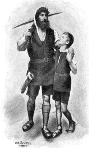
Die Schweizer 1894

Tellgruppe aus der Tellaufführung in Brugg 1899.