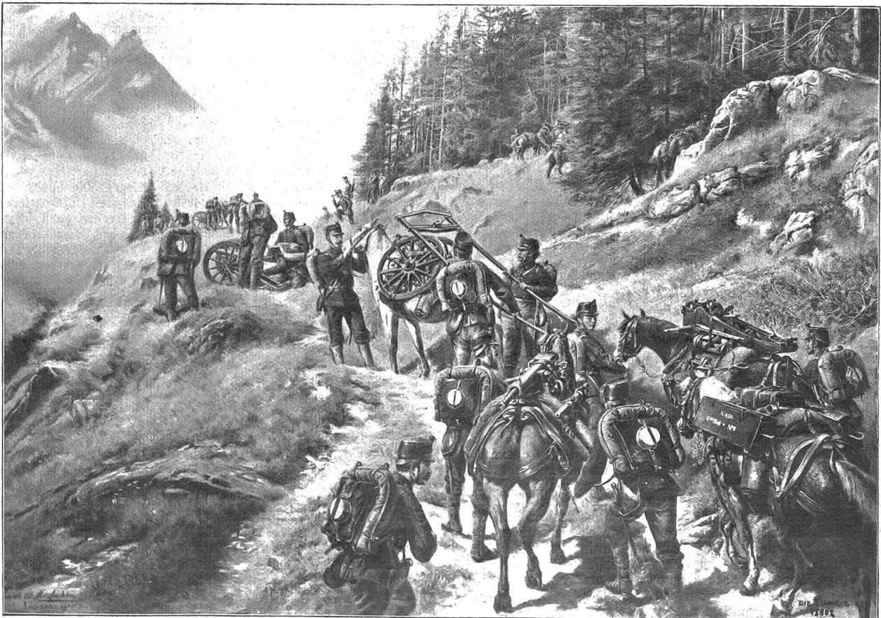
Schweizerische Gebirgsartillerie. Nach dem Gemälde von Joseph Clemens Kaufmann, Luzern.