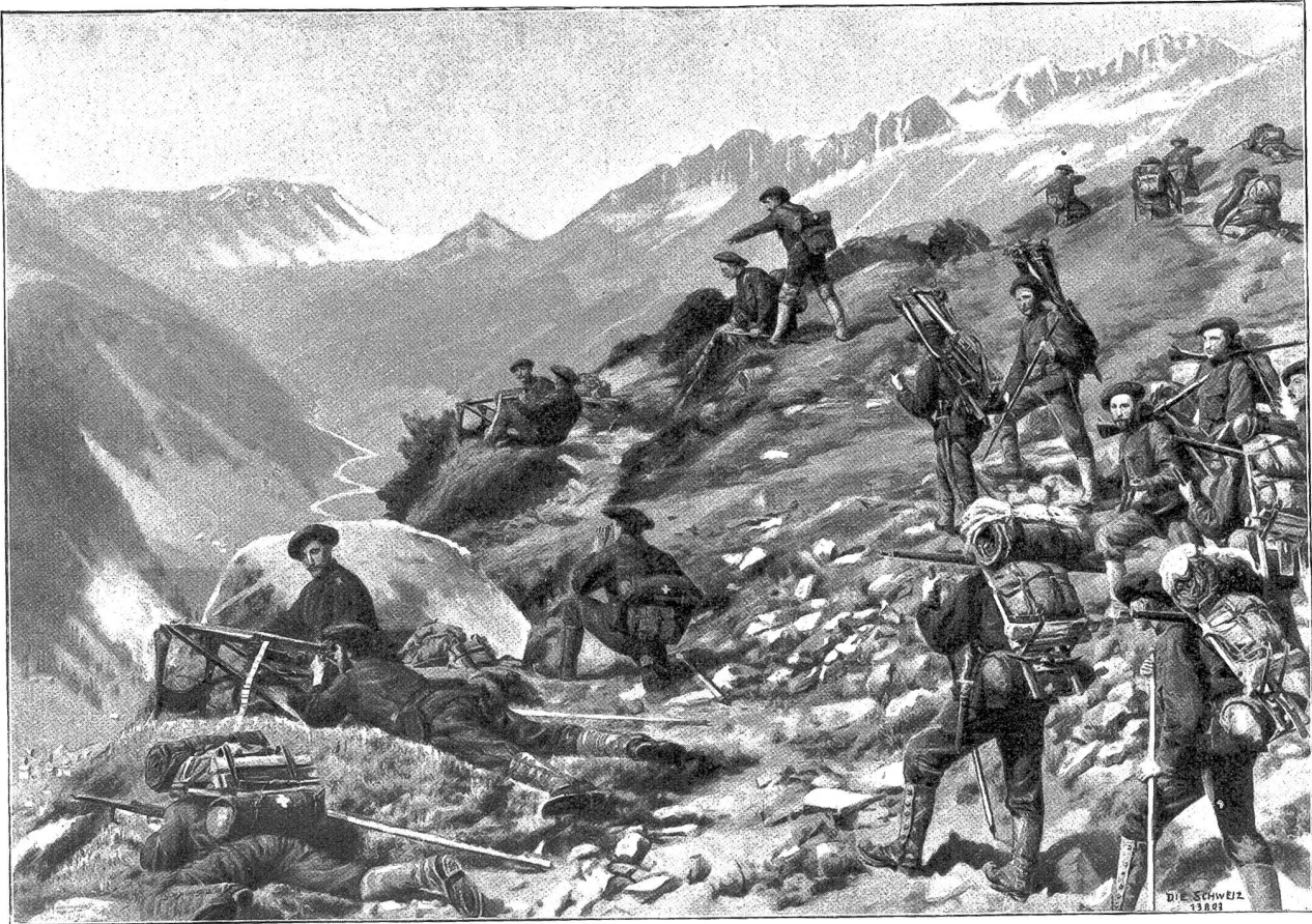
Schweizerische Maximschützen am St. Gotthard. Nach dem Gemälde von Joseph Clemens Kaufmann, Luzern.

rippe herum, unter einem Fels durchkriechend, auf einem Felsfims, platt an die Wand gedrückt, traversierend, mit einem Sprung über eine tiefe Rinne, steil hinab auf felsigem Rasenhang des rechten Ufers der Reuß zur Sprengbrücke, die ohne jeden Unfall um 4 \frac{1}{4} Uhr nachmittags erreicht wurde. Um 5 Uhr 20 Minuten traf die Kolonne wieder in Andermatt ein.