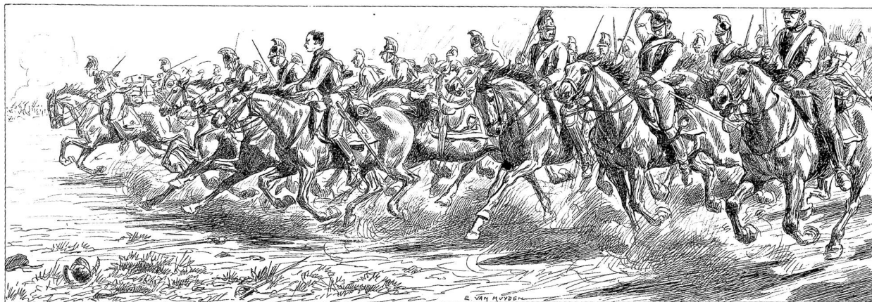
Oesterreichische Kürassiere. Kopfstücke von Evert van Nuyden.