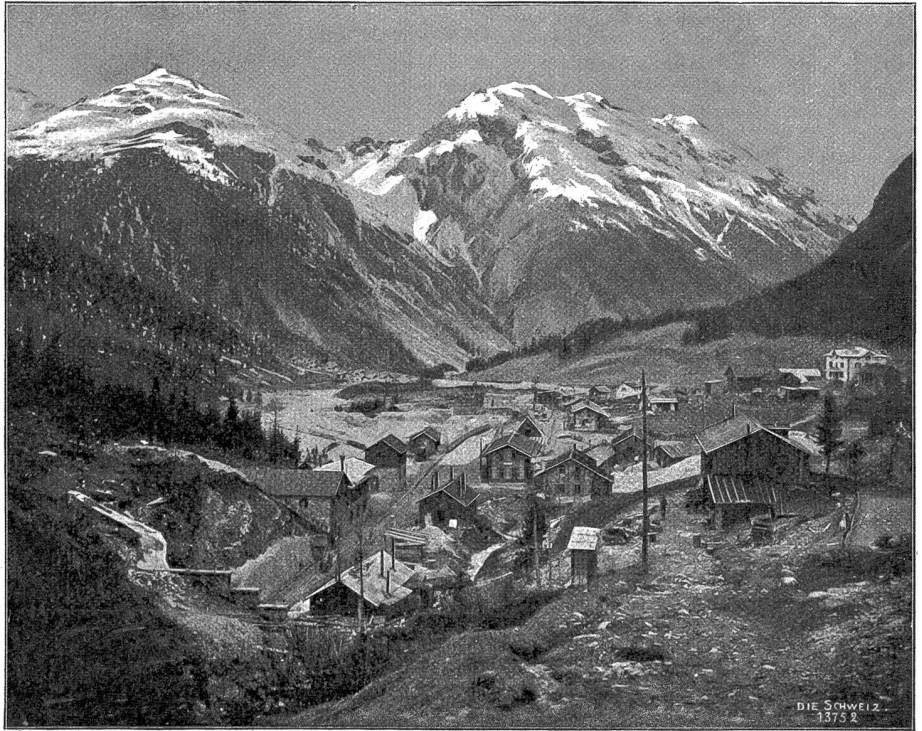
Breda, die Nordpforte des großen Albulatunnels (1820 m ü. M.).

Elisabeth, die älteste, hatte Haare von der Farbe des Ebenholzes und Augen so tiefdunkel und funkelnd wie die