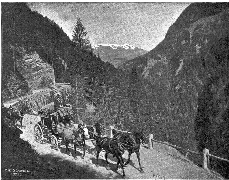
Engabin-Post im Schnypaß zwischen Thusts und Tiefenlaken.

Inzwischen war die Kunde von den drei schönen Haslilungfrauen auch bis ins Emmenthal gedrungen. Dort lebten auf einer der schönsten Alpen drei junge Sennen, stark wie Stiefen. Diese waren eins geworden, die drei berühmten Mädchen im Haslithal zu freien. Der Jüngste durfte sich rühmen, kürzlich einen der wildesten, gewaltigsten Stiere, die es je in den Emmenthaler Bergen gegeben, zu Boden geworfen und bezähmt zu haben, indem er ihn bei der Nase und den Hörnern packte und mit kräftigem Auck auf die Seite drehte. Der Zweite trug einmal eine schwere Kuh von einem Felsenband, auf das sie sich beim Herannahen eines Gewitters gerettet und wo sie nun weder vorwärts noch rückwärts konnte,