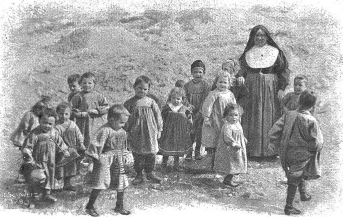
Unterste Schulklasse der Zukunftsstadt (!) Breda. (Phot. Chr. Conrad, Lucens, Waadt).

Viele Leute behaupteten, die drei Jungfrauen besäßen ein Zaubermittel, dem sie ihre wunderbare Schönheit, Gesundheit und Jugendfrische zu verdanken hätten. Man sprach von wunderthätigen Quellen im Innern der Aareschlucht, in denen sie sich von Zeit zu Zeit baden sollten. Und in der That wurden sie öfters frühmorgens gesehen, wie sie für