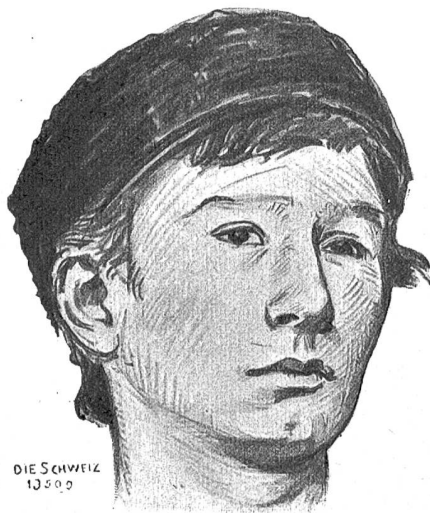
Skizzen zu unserm Titelblatt „Fahnenjunker“ von Richard Schupp.