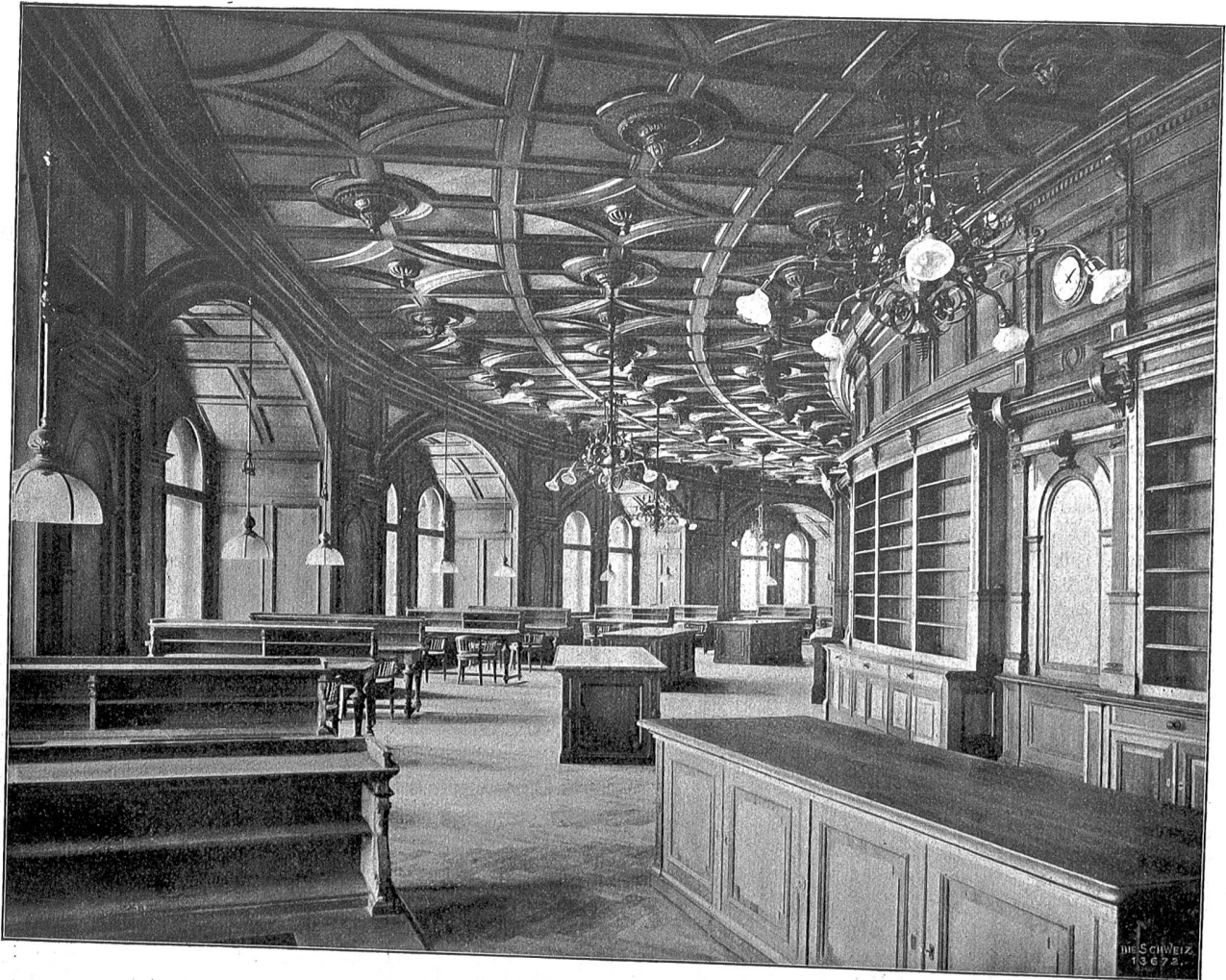
Bibliothek im neuen Bundeshaus.

So ging's bei jedem neuen Stück; immer wieder, wenn die Mutter die Pause benützte, um zu Margret ein paar beifällige Worte zu sagen, wachte diese wie aus tiefem Schlaf und Traum auf und sah mit großen, staunenden Augen umher . . .