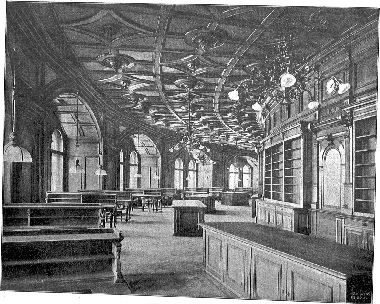
Bibliothek im neuen Bundeshaus.

So ging's bei jedem neuen Stück; immer wieder, wenn die Mutter die Pause benützte, um zu Margret ein paar beifällige Worte zu sagen, wachte diese wie aus tiefem Schlaf und Traum auf und sah mit großen, staunenden Augen umher . . .