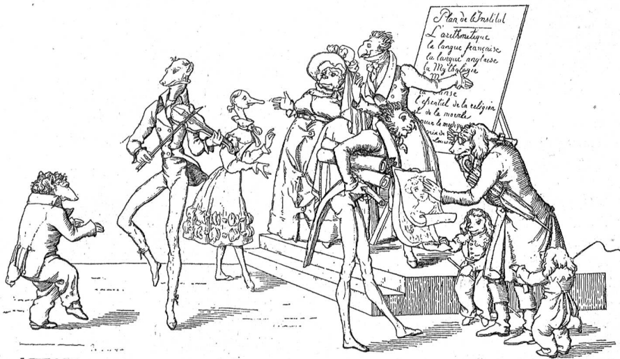
Auch ein Institut. (Nach A. G. Fröblich's Fabeln). Hund, Affe und Papagei gründeten zusammen ein Institut und machten bekannt, das sie sich entschlossen haben, Töchter und Knaben in Religion und Tugend und auch im Tanz zu unterweisen.

Hinter dem Stamm des Rirschaumes, der in der Nähe des Brunnens emporragte, regte sich jetzt etwas, eine braune Gestalt und ein sonnenverbrannter Kopf kam zum Vorschein. Es war der Knecht. Er streckte eine Hand hervor, in der er einen ungewöhnlich langen Halm festhielt; mit diesem suchte er die ahnungslos dastehende Dirne im Nacken zu kitzeln. Erst führte diese ihre Rechte mit raschem Schwung nach der berührten Stelle, wie um eine Fliege wegzuschleichen; als jedoch ein wiederholtes Gramseln sie störte, drehte sie sich rasch um und kam noch eben zur rechten Zeit, den fliehenden Arm zu entdecken. Mit Blitzesschnelle tauchte sie jetzt ihre braune Hand in's Wasser und warf einen in den Sonnenstrahlen silbernen perlenden Spritzer nach der Stelle, wo der Gegner stand. Lachend und mit komischer Gebärde die Nase von den Kleidern schüttelnd tappte der Knecht hervor und floh vor den ihn verfolgenden Wasserstrahlen nach dem Stall.