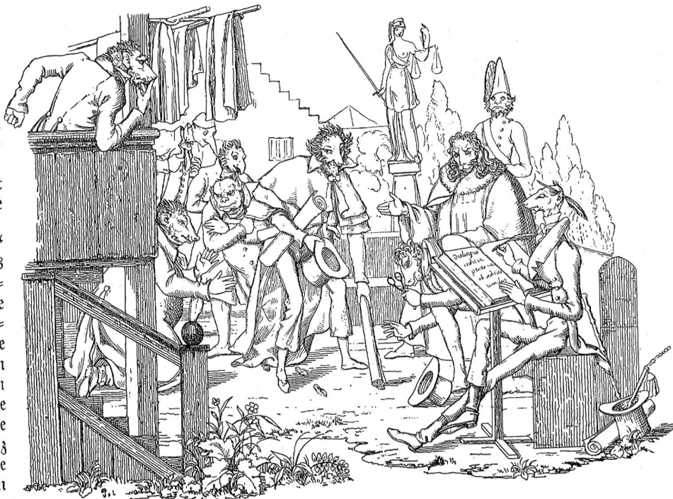
Liebesmäntler. (Nach A. G. Fröhlich's Fabeln).

Ja, die Mutter! Margret hatte ihrer im Glück ganz vergessen; nun befahl sie eine große Bangigkeit, und so bat sie den Geliebten, sie auf dem kürzesten Weg wieder nach der Stadt zu geleiten.