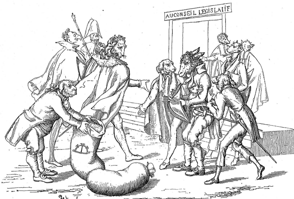
Volksvertreter. (Nach A. G. Fröhlich's Fabeln).

Es dämmerte schon, als die Beiden am Ausgangspunkt ihrer Wanderung angekommen waren. Noch gaben sie sich ein liebes Wort zum Abschied mit, reichten sich die Hände und versprachen sich, „übermorgen“ hier