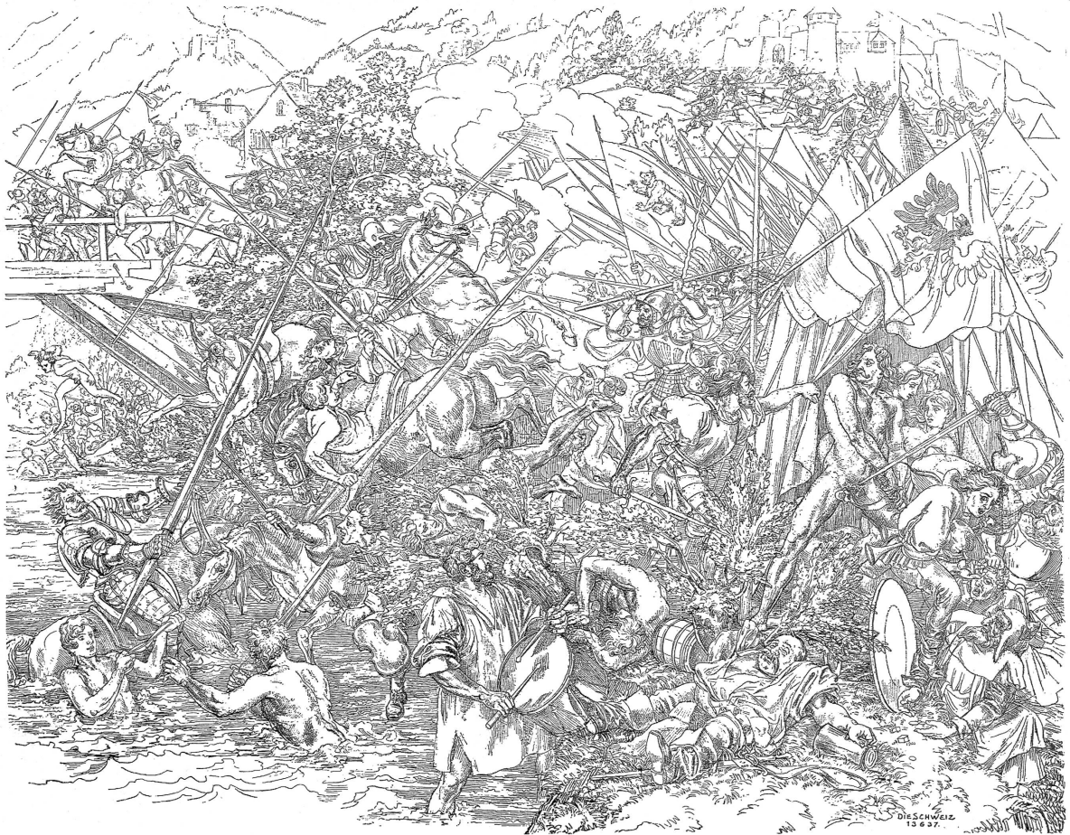
Die Schlacht bei Dornach (22. Juli 1499). Originalzeichnung im Dinkel-Museum zu Olten.

Graf Heinrich von Fürstenberg war mit 16,000 Mann aus dem Sundgau in die Schweiz eingebrungen und lagerte sich an der Wies bei Dornach, während der Kern der Eidgenössischen Streiter im Thurgau mit Erzhzog Maximilian kämpfte. Es war der Festtag der Maria Magdalena, der ohne Ordnung und Vorsicht im Lager lustig begangen wurde, sobald dieses einem fröhlichen Jahrmartt glich. So wurde es von etwa viertausend Solothurnern, Bernern und Zürichern überfallen. Nach anfänglichem Vorteil aber kamen die Eidgenossen arg ins Gedränge und hätten die Schlacht verloren, wären nicht zu schon vorgerückter Stunde 1200 Luzerner und Jäger ob Arlesheim aus dem Wald hervorgebrochen und ihnen zu Hilfe gekommen. Jetzt belebte neue Kraft die Erstköpften, und sie erkämpften einen glänzenden Sieg über den weichenen Feind.