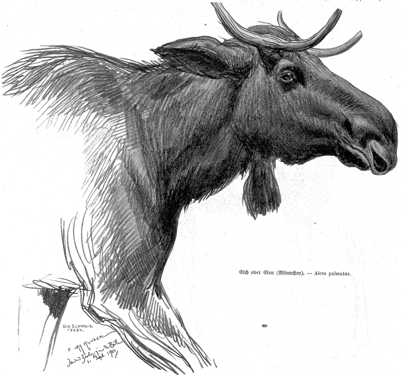
Elch oder Elen (Männchen). — Alces palmatus .

Je mehr er dieses Bestreben zu erkennen gab, desto begehrenswerter fand sie ihn. Je mehr er sich stellte, eine Liebe, die als Schuld gelten konnte, nicht zu erstreben, desto mehr fühlte sie sich geneigt, das zu gewähren, was nicht verlangt wurde. Der allabendliche, förmliche, in Gegenwart der Großmutter gegebene Kuß machte sie vibrieren wie eine Glocke. Sie dachte an ihn bis zum nächsten Tag und ersehnte ihn wie die köstlichste Liebeskostung. Während seine Hand kühl und lässig blieb, hätte sie sich gern in die Arme dieses unempfindlichen