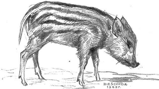
Wildschwein (Frischling). — Sus scrofa .

Es erscheint hier geraten, Edna noch vor ihrem Erscheinen kennen zu lernen, um sie ein wenig besser beurteilen zu können, wie Heropian.