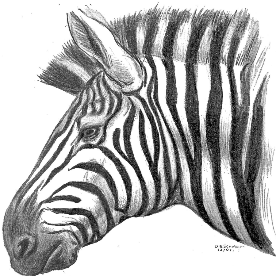
Zebra ( Equus Chapmanii ).

„Zimmer wieder die Theorie der Orangeade!“ sagte