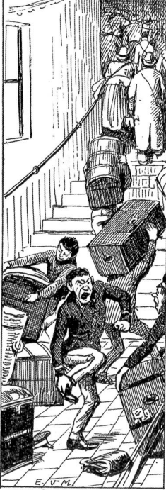
E. V. M. DIE SCHWEIZ. 13497

der Amtsrat jetzt in den Wagen gehoben und nach Hause gefahren wurde. Man schien dort einen Unfall