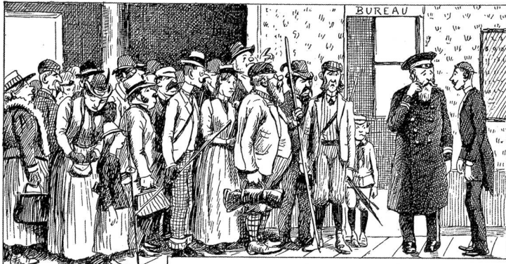
Juli. Wo alles unterbringen?