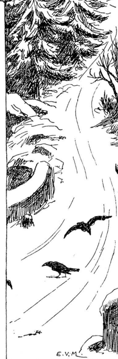
E.V.M. DIE SCHWEIZ. 13502

"Für morgen und für alle folgenden Tage," erwiderte Alexandrine, sich gleichgiltig stellend, um ihre Qualen zu verbergen.