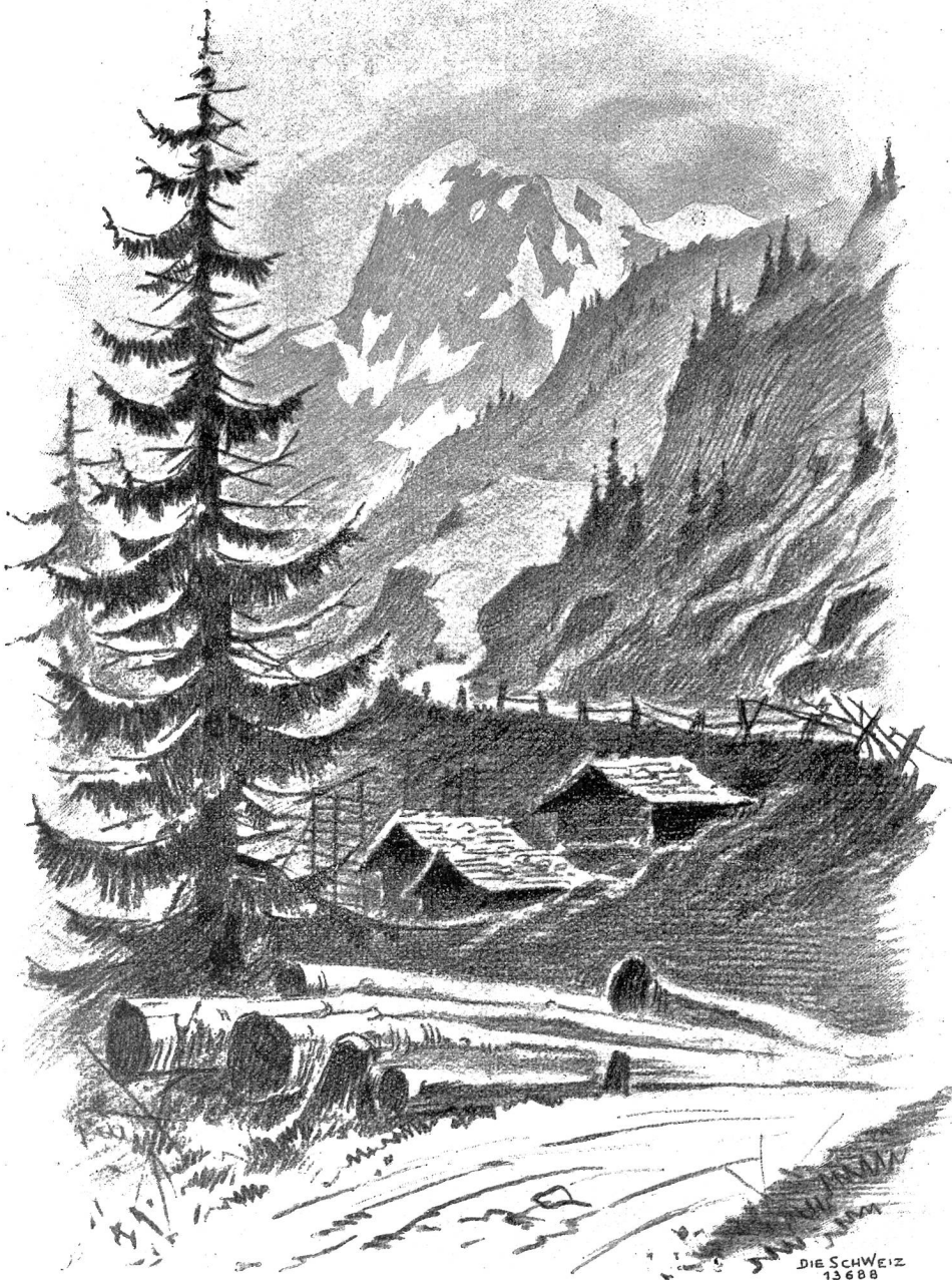
Auf der Lukmanierstrasse (Rückblick auf den Töbi). Nach Zeichnung von Jakob Willeter, Basel.