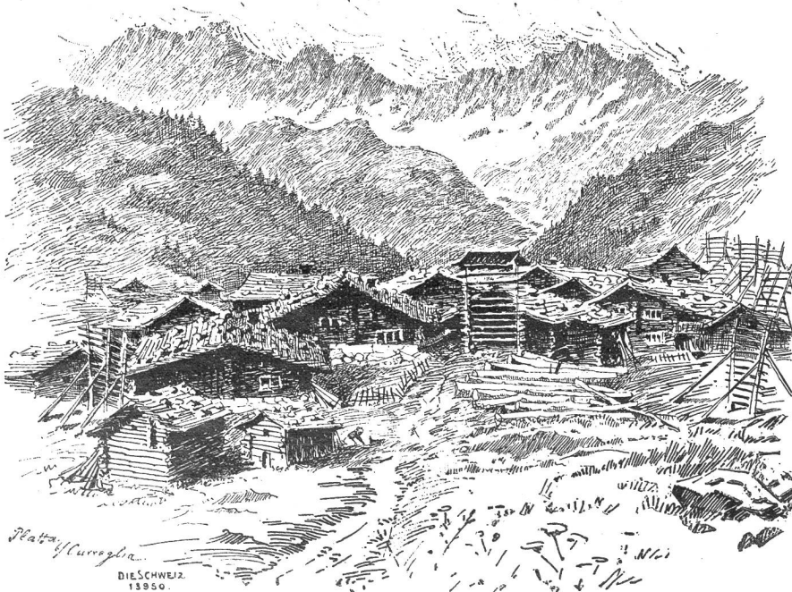
Platta an der Lukmanierstraße (Rückblick auf die Oberalpstockette). Nach Federzeichnung von Jakob Billiter Basel.

Also bewegen wir uns auf einem Terrain, wo von keinem lawn tennis, von lunch und five o'clock die Rede ist, aber auch auf Pfaden, wo man nicht auf Schritt und Tritt riskieren muß, von einem Löstföb angestänkert oder überrannt zu werden.