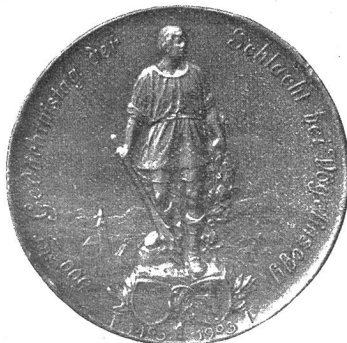
Appenzeller Denkmünze, entworfen von Kaufmann, Luzern.

Auch vom technischen Standpunkt aus betrachtet verdient das Kunstblatt die Aufmerksamkeit des Lesers; es ist nicht nach einem Gemälde erstellt, das der Phantasie eines Schönheitsempfindenden Künstlers seinen Ursprung verdankt, sondern es ist der naturwahre Abdruck der photographischen Platte. Und, daß das Bild ein Spiegel der Wirklichkeit ist, verleiht ihm gewiß besondern Wert. R. G.