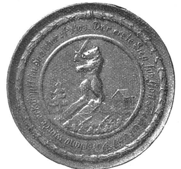
Rückseite der Appenzeller Denkmünze mit Wappen von Speicher.