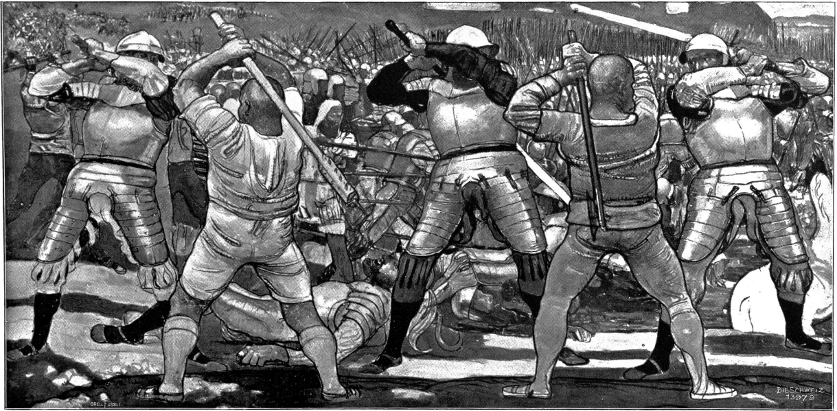
Episode aus der Schlacht bei Näfels. Nach dem Fresgemälde (1897) von Ferdinand Hodler, Bern, in der öffentlichen Kunstsammlung von Basel.