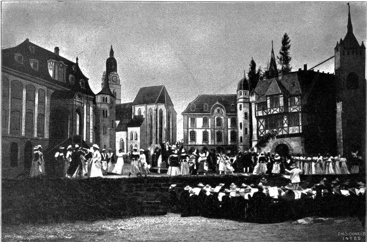
Vom aargauischen Festspiel. Akt IV: Aufrichtung des Freiheitsbaumes in Zofingen (1798).