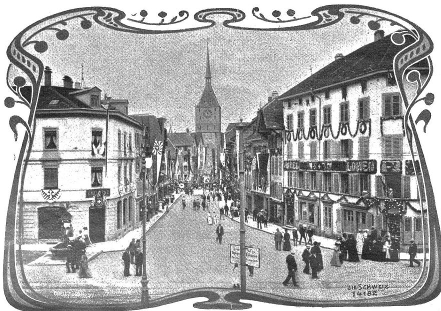
Aarau im Festschmuck.