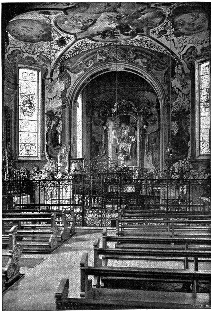
Inneres der Klosterkirche Fahr bei Zürich (Phot. Ph. & C. Lint, Zürich).

Viel hübscher und beweglicher ist ein Tanz der Männer, der auch am hellen Tage auf der flachen Erde aufgeführt wird, das sogenannte Mentja. Auch verheiratete Männer beteiligen sich oft dabei. Die dritte Abbildung stellt uns eine solche Ausführung, einen eigentlichen Kriegstanz dar. Auf einem freien, viereckigen Platz stellen sich zwei Männer diagonal einander gegenüber. Die Musiker beginnen die Gendangs und Gongs zu bearbeiten (das Gamelang wird beim mentja nicht benutzt),