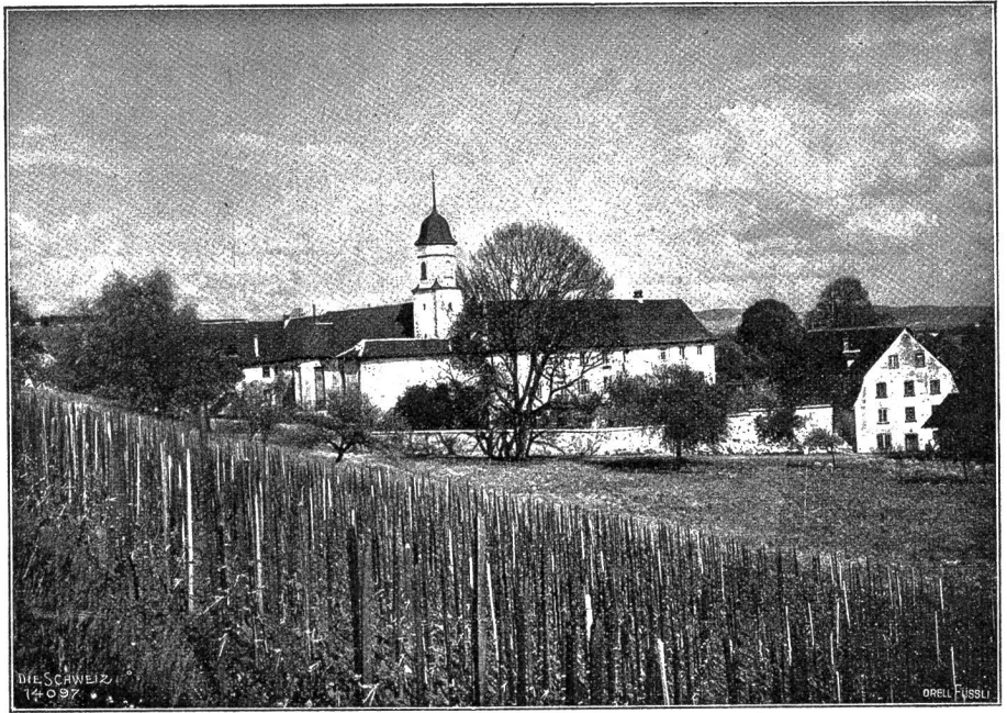
Kloster „Fährli“ im Limmattal bei Zürich (Phot. A. Krenn, Zürich).

angenehmes Neuheres, und falls zwei Bewerberinnen um den Posten sind, wird die, deren Vater einen höhern Rang ein-nimmt, bevorzugt.