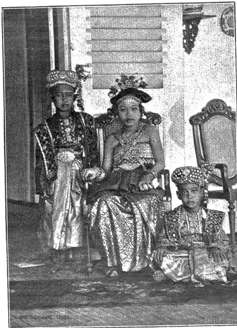
Abb. 1: Kinder des Depati von Sekaju (Muji), Residenz Palembang, Sumatra.

In jener Gegend hatte ich längere Zeit zu tun und war auf die Hilfe der Häuptlinge angewiesen. Ich ließ sie deshalb zu einem Essen im Balai, den ich inzwischen bezogen hatte, einladen, und abends erschienen die Notabilitäten festlich gekleidet und mit ihrer, den Rang anzeigenden Mütze geschmückt. Die Tischordnung war die folgende: ich