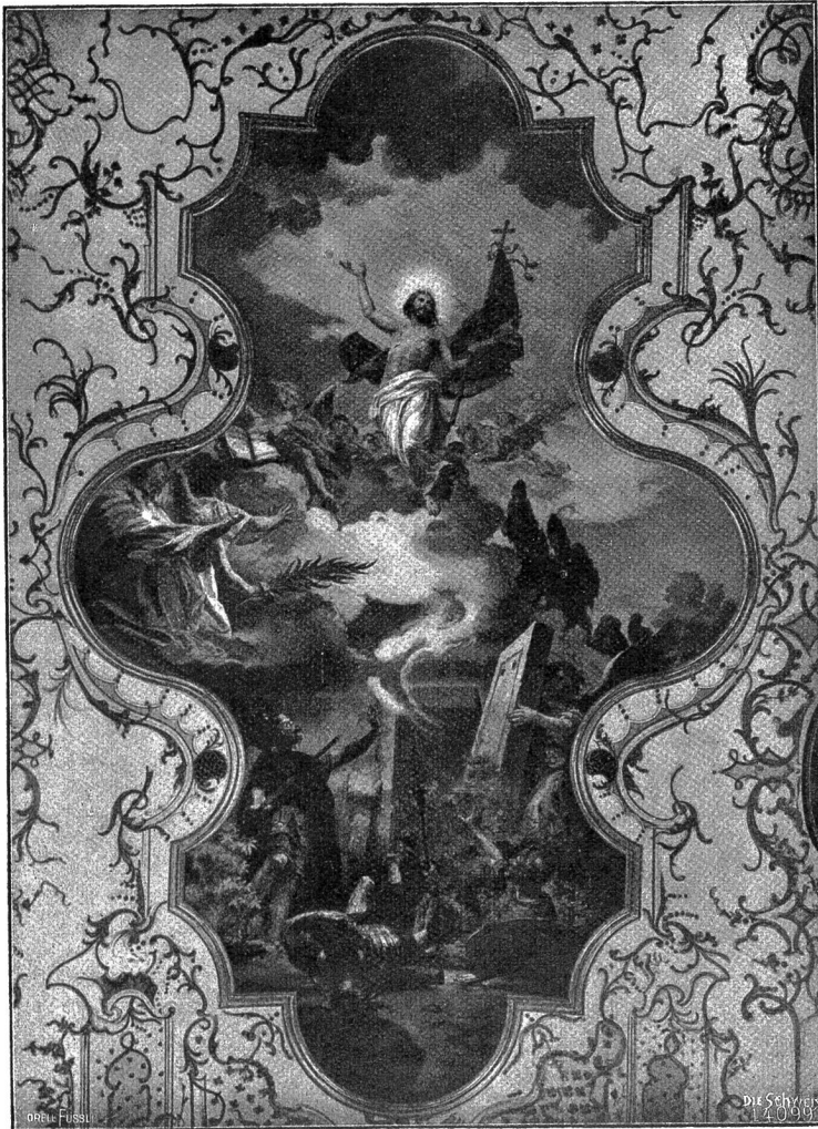
Deckengemälde in der Klosterkirche Fahr bei Zürich (Phot. A. Krenn, Zürich).

wobei sie sehr viel Abwechslung in den Takten haben. Jedenfalls ist diese Musik mindestens so angenehm wie unser Trommeln. Der eine der Tänzer beginnt. Er klatscht einmal in die Hände oder schlägt sich auf die Knie, geht einige Schritte vorwärts, dreht sich und beginnt nun gegen einen nicht vorhandenen Gegner zu hagen, bald nach vor- und rückwärts, bald nach den Seiten, dann geht er wieder auf seinen Platz zurück. Nun beginnt der andere auf die nämliche Weise, während der