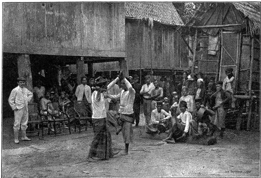
Abb. 3: Tanzende Männer (Mentja) in Belanie (Rawas), Residenz Palembang, Sumatra (Phot. de Nijf).