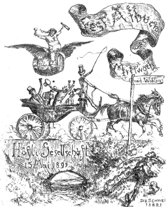
Zur Ausfahrt der Mittwoch-Höflich-Gesellschaft nach Wohlen. Nach der Radierung von Albert Welti.

Selbstvorfürfen, ist auf dem Punkt nachzugeben. Ihr Ernst ist so groß, daß er nicht wagt, sie zurückzuhalten.