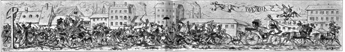
Die Jagd nach dem Glück. Nach der Modierung von Albert Welfi, Zürich-Wädwil.