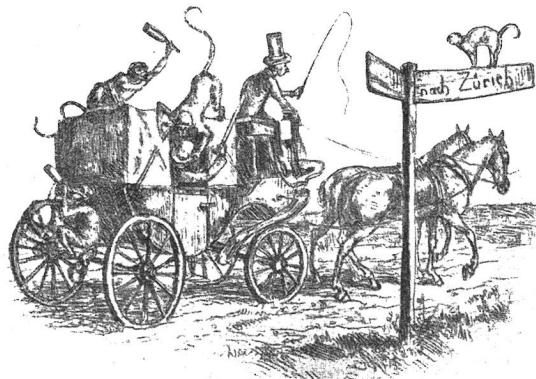
Zur Ausfahrt der Mittwoch-Höflich-Gesellschaft nach Wohlen. Nach der Radierung von Albert Welti.

„Nun,“ sagt er mit gezwungener Ruhe, immer noch auf die Nachricht starrend, „das ist wenigstens deutlich und läßt kein Mißverständnis aufkommen.“