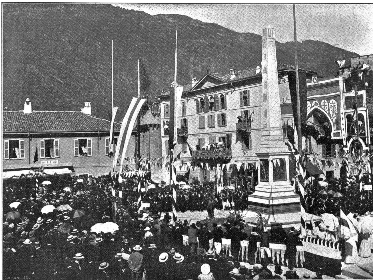
Von der Tessiner Jahrhundertfeier in Bellinzona: Einweihung des Freiheitsdenkmals auf dem St. Rochusplatz am 10. Sept. 1903.

Vertreter der eidgenössischen und kantonalen Behörden und eine vieltausendköpfige Menge wohnten der erhebenden Feier bei. — Daran schloß sich ein hübsch arrangierter Umzug. Zwei der schönsten Gruppen führen wir unsern Lesern vor. Besonders die eine, die „Blumenkönigin“ verriet in ihrem Arrangement einen so feinen Geschmack und eine solche Virtuosität in der Verwendung von Blumen als Dekoration, daß dieser Wagen dem elegantesten Blumenkorso Nizzas alle Ehre gemacht hätte.