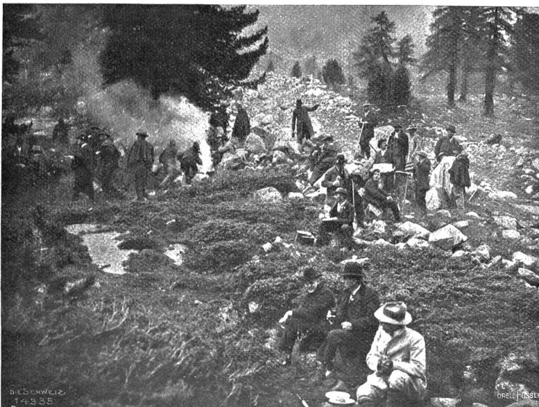
Vom Zentralfest des S. H. C. (12.—14. Sept. 1903): Picknick auf der Schinetta bei Pontresina.

Der Tessin gehört zu den Kantonen, die diesen Sommer die Feier ihres hundertjährigen Bestehens begehen konnten. Dieses erste Jahrhundert politischer Unabhängigkeit, auf das das Tessinervolk zurückblicken kann, ist reich an stürmischen Zeiten, Momenten wilden Parteihaders. Es brauchte beinahe das ganze Säkulum, bis sich unsere Brüder jenseits der Alpen in der Selbstregierung zurechtgefunden hatten, und einigemal mußte sogar Mutter Helvetia eingreifen, um das Gleichgewicht wiederherzustellen. So kam es, daß die andern Kantone etwas von oben herab auf dieses Sorgenkind blickten und sich weigerten, es als völlig gleichberechtigt anzuerkennen. Die Tessiner jedoch bemühten sich, gerade durch ihre Jahrhundertfeier zu beweisen, daß sie diese Zurücksetzung nicht mehr verdienen, sondern daß sie jetzt imstand sind, auch ohne Nachhülfe von seiten des Bundes ihren schönen Kanton im Frieden miteinander zu regieren. Den Hauptakt der Feierlichkeiten, die sich über eine ganze Woche erstreckten, bildete die Einweihung des F r e i h e i t s d e n k m a l s auf dem St. Rochusplatz, eines Werkes der Bildhauer Albisetti & Neukomm, das der Leser hier abgebildet sieht.