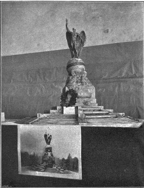
Weltpostvereinsdenkmal: Entwurf von Georges Morin, Berlin (Preis Fr. 3000).

stellten natürlich auch Uebergänge von den ältern zu neuern Auffassungen dar. Die besten suchten dann in die schöne Form noch einen innerlichen Gehalt hineinzulegen, der ihrem Werk eine tiefere Wirkung verleiht, besonders schön der einfach große Entwurf, der durch seinen strengen Stil auf die Autorschaft Franz Meznerns (früher in Berlin, jetzt in Wien) raten ließ. Die vereinigten Staaten der Welt waren in wenigen, prächtig charakterisierten Figuren als Repräsentanten der fünf Erdteile und ihrer Kultur um die große Form der Weltkugel gruppiert. Bei einzelnen Entwürfen überwog die Sprache der Architektur, für die Bruno Schmitz durch seine großartigen Denkmalbauten auch das Gebiet der Denkmalkunst wieder erobert hat. Ein eigenartiger Entwurf dieser Art brachte den ungehemmten Fluß des Verkehrs zu schönem Ausdruck durch eine groß angelegte Brunnenanlage, bei der das Wasser über die hohe Plattform einer tiefen Nischenarchitektur von Bassin zu Bassin stürzt, hervor aus einer Vertiefung der die Plattform bekrönenden Architektur, aus der wie ein Geist Merkur mit der eilenden Flut daherkommt. Solche höhere Symbolik berührt gegenüber der ungebundenen Rede der alles personifizierenden, genrehaften Denkmalgestaltung wie ein Epos, als eine lebendige Verherrlichung eines großen Gedankens.