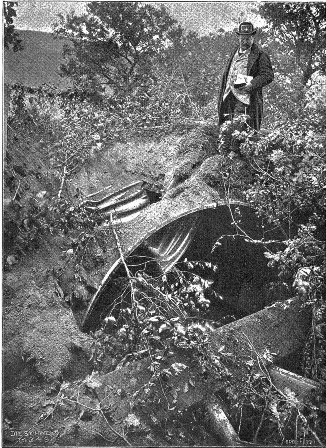
Befestigung am Zibhkanal: Wirkung einer 12 cm Granate auf geschützte Infanterie-Unterstände (Phot. A. Krenn, Zürich).

„Könnten Sie das Ereignis nicht beschleunigen, Sir Aulsten?“ fragt jetzt Cyrus. „Sie lassen sich natürlich hier vor dem Konsul trauen?“