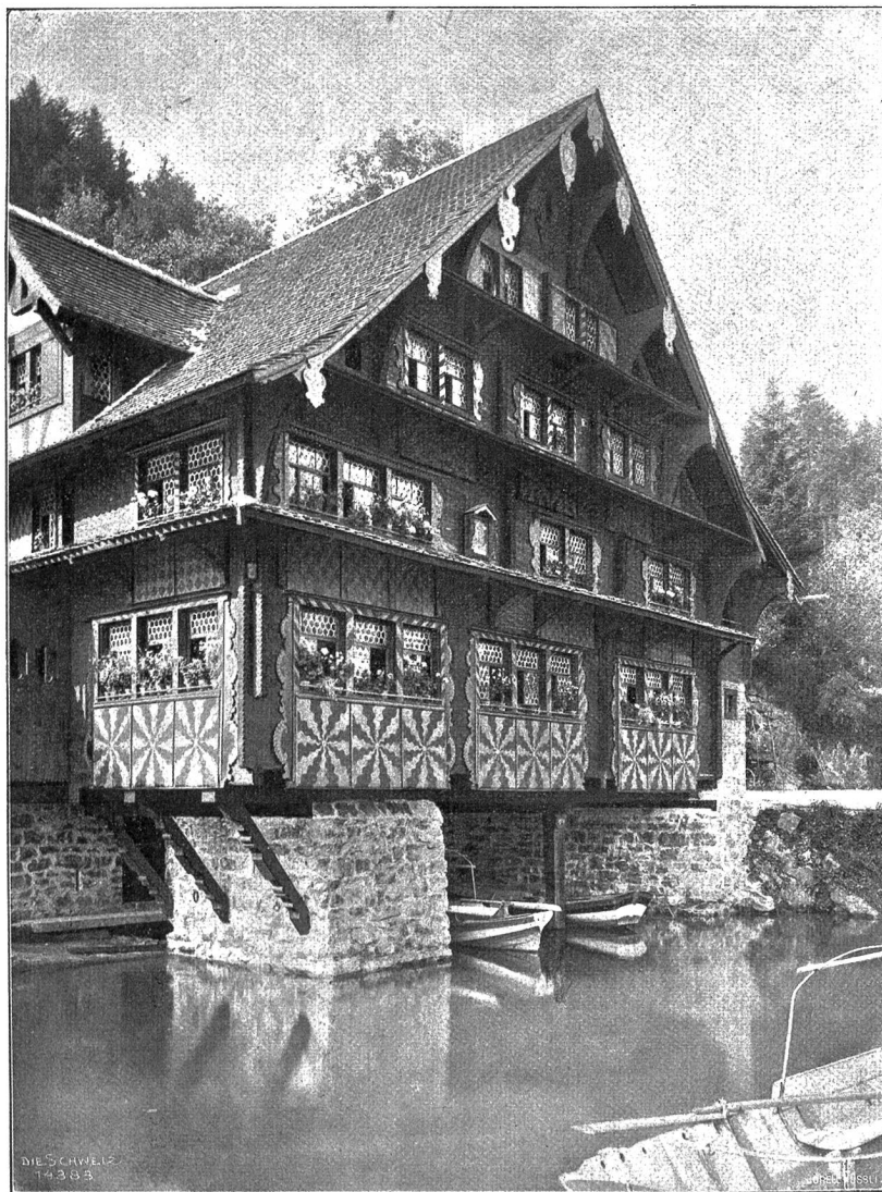
Das Haus zur Treib nach der Wiederherstellung durch Eugen Probst, Zürich.