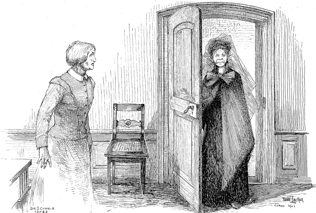
Durch die Oeffnung der Thüre wand sich ein hageres mittelgroßes Weib: „Das Mitleid!“ schauderte Mütterchen . . .

anstatt so polterig und so unartig davonzulaufen. So, dann mußte er's.