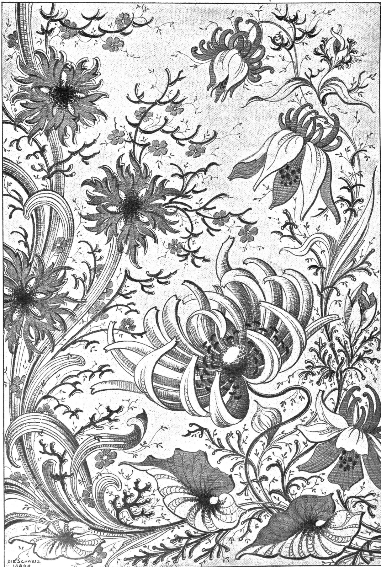
Blumenmotive für Zeichner von Ferd. Wänziger, Seiden.