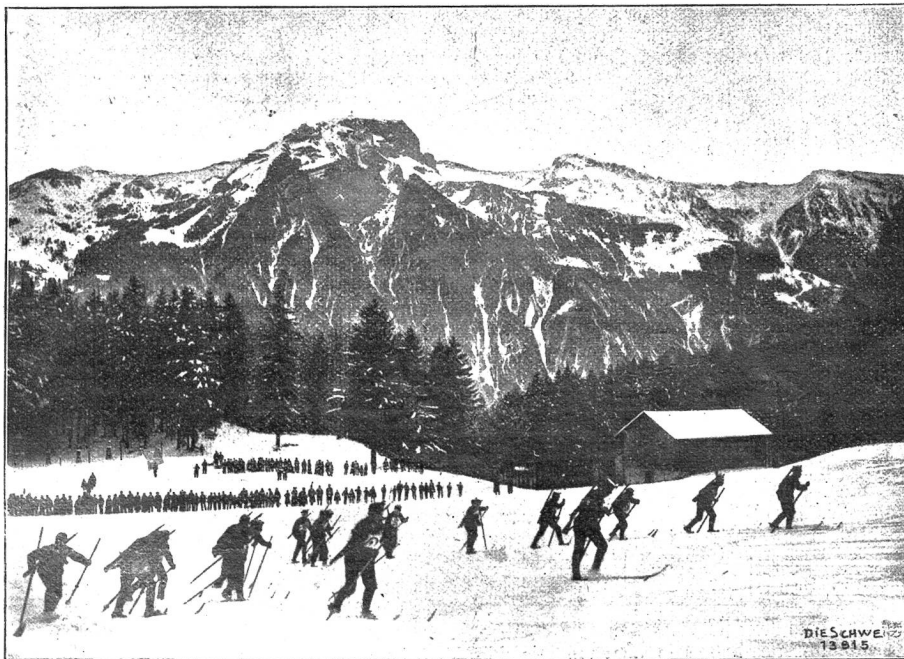
Militär-Ski-Rennen in Glarus.

eingeführt, von einer Popularisierung und praktischen Verwendung der Schneeschuhe konnte aber bis in jüngste Zeit keine Rede sein. Erst ihre Einführung bei der Gotthardbesetzung vermittelte deren Bekanntheit weitem Kreisen, und in den letzten Wintern nahmen auch die mit Skiern unternommenen Bergtouren derart zu, daß sich die Bergführer gezwungen sahen, sich mit diesem