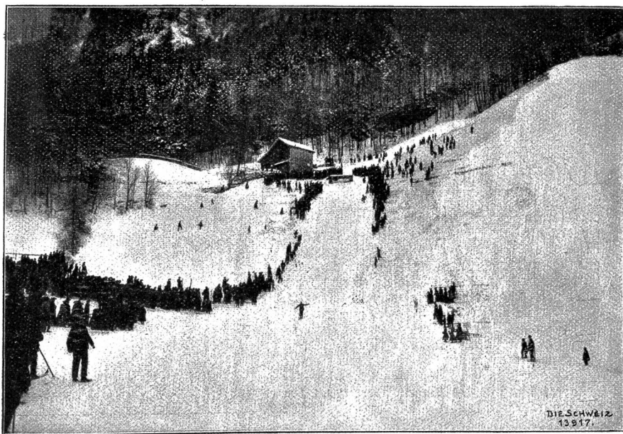
Die Glarner Ski-Sprungbahn nach norwegischem Muster. (Geherdahl nach glücklichem Sprung abfahrend).

Die größte Anziehungskraft auf die Zuschauer übte das norwegische Sprungrennen aus, für das an der steilen Berglehne des Glärnisch eine besondere Bahn hergerichtet war. Ihre Anlage geschieht folgendermaßen: nach einer etwa dreißig Meter langen, sehr stark geneigten Anlaufstrecke wird ein kurzes Stück beträchtlich aufgeschüttet und nach vorne zwei bis drei Meter tief senkrecht abgegraben, sodaß eine hohe Stufe entsteht, die wie ein Sprungbrett wirkt. Jeder Gegenstand, der die Bahn