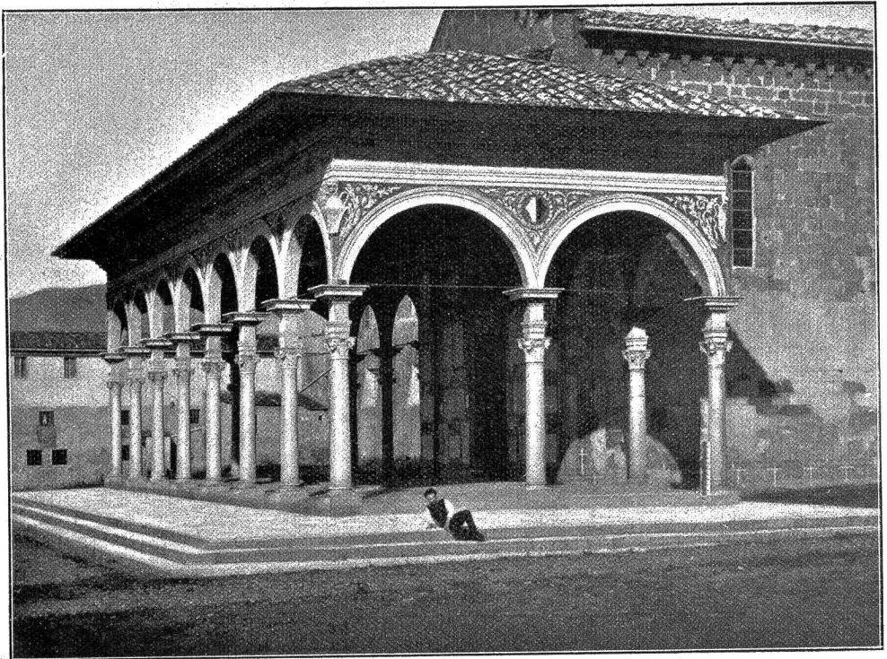
Arezzo Abb. 4: Vorhalle von Santa Maria delle Grazie.

Als die haberdenden Brüder den Schlußstein fügten, berührten sich zufällig ihre Hände. Sie standen Brust an Brust; das Herz schlug ihnen höher, teils vor Freude über die vollendete Steinbildung und teils unter einer aufwallenden Empfindung der alten Liebe. Und weil sich bei einem gleichzeitigen Vorbeugen ihre Stirnen berührten, konnten sie nicht anders als sich ansehen, einmal mit einem scheuen Streifblick, und noch einmal mit einem verwunderten Erwaschen in den Augen. Und zum dritten Mal sahen sie einander offen und klar in das Antlitz, daß die Sonnenblitze von Seele zu Seele zuckten und die verschüchterten Liebesfeuer wieder hell aufzuflammen begannen. Und mit dem alten treuen