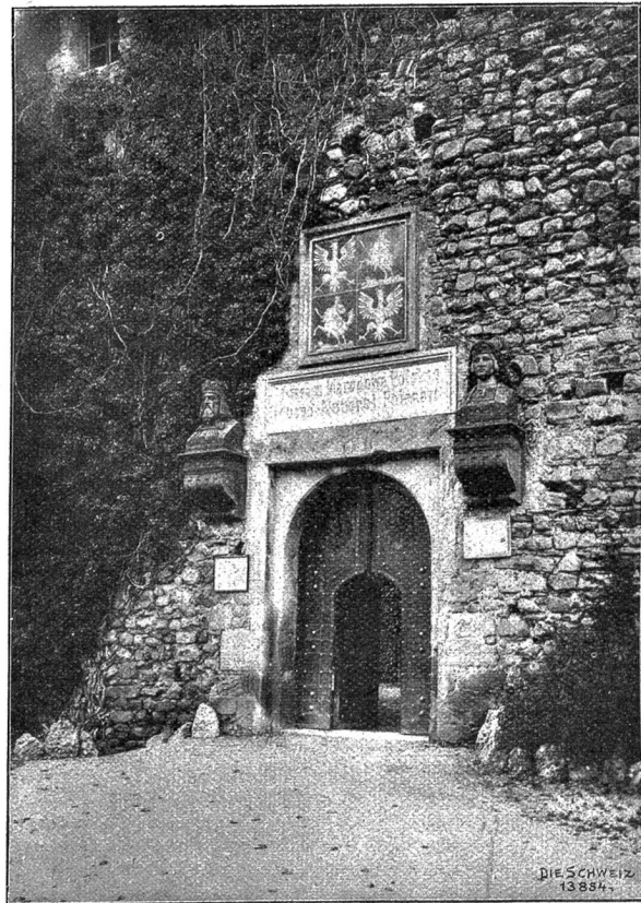
Eingang zum Polenmuseum. Ueber dem Tor die Büsten von Kasimir III. d. Gr. und Jadwiga.