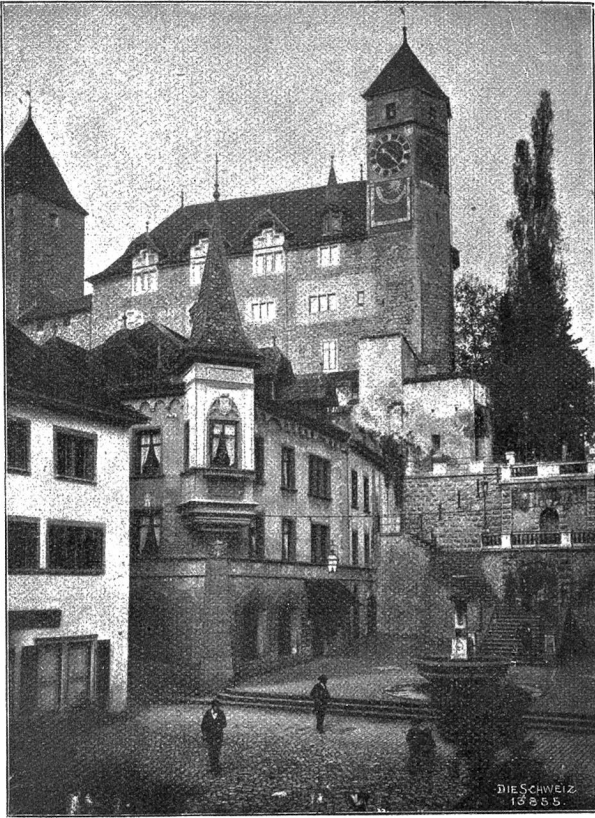
Schloss Rapperswil am Zürichsee, 1869 von Graf Plater zu einem polnischen Nationalmuseum eingerichtet.

weis der mächtigen Entwicklung, die die Hauptstadt genommen, und infolge der Erbauung des bakteriologischen Institutes steht sie gegenwärtig auch in gleicher Höhe mit allen andern wissenschaftlichen Zentren Europas.