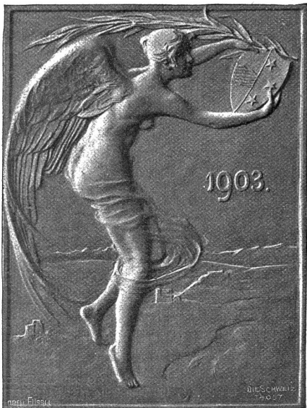
Plakette zur aargauischen Jahrhundertfeier (Mittelfeite).

gestalteten Kopfe getrenntlich wieder, und auch die übrigen Figuren im Vordergrund haben ganz individuelle Züge. Wir sehen Stapfer, wie er, soeben aus Paris zurückkehrend, den Beratern des Aargau die wichtige Urkunde überreicht. Ohne Jubel, ohne Begeisterung, mit Würde und Gelassenheit nehmen die Beschenkten die Gabe entgegen, entsprechend der Stimmung jener Zeit. Die