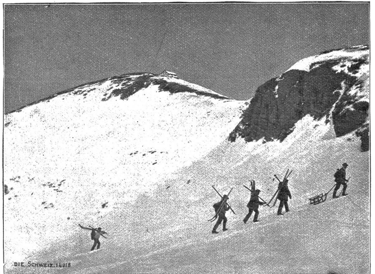
Faulhornbesteigung im Winter: Aufstieg zum „Gassenboden“; auf der Höhe das Hotel Faulhorn.

Die Luft, bis dahin sömmerlich warm, beginnt kühler zu werden. Die Hochgipfel sind in eine zarte rosige Blut getaucht,