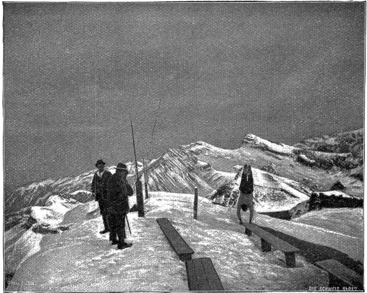
Faulhornbesteigung im Winter: Auf der Spitze des Faulhorns.

Vom Lauteraarsattel herüber weckt die späte Morgensonne den späten Schläfer nach einem traumlosen, herrlichen Schlummer. Der erste Gang gilt der wenige Schritte höher gelegenen Spitze des Faulhorns, der so oft, aber nie genug bewunderten Mund-