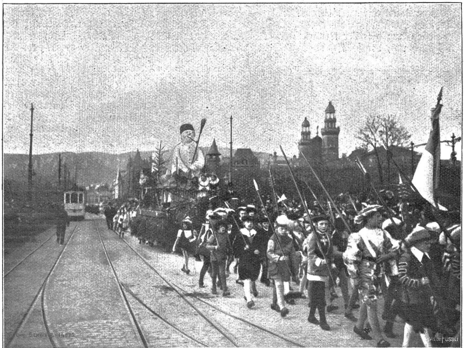
Vom Zürcher Sechseläuten 1903: Alte Schweizer im Kinderumzug (Phot. A. Krenn).

Vor etwa drei Jahren ist Hohenwald zum Bezirksort (County-seat) erhoben worden, und gegenwärtig schmückt ein geräumiges, viereckiges Gebäude zweifelhaften Stils das angehende Städtchen. Dieses Holzgebäude ist das Gerichtshaus und hat unsere Schweizeransiedlung als Bezirksort zu einigem Ansehen gebracht. Es liegt etwas abseits, von einer kleinen Klärung umgeben; sonst verrät nichts weiter, daß der Platz der sogenannte Citysquare sein soll. Doch steht schwarz auf weiß auf dem Plane Hohenwalds. Großartiger noch als das Rathaus wirkt das erst letztes Jahr entstandene Bezirksgefängnis, groß und imposant für die spärlich besiedelte Gegend. Ein rotes Backsteingebäude, guckt es gar freundlich zwischen den Bäumen hervor. Es soll wunder was für moderne Einrichtungen haben und lockt Besucher an von nah und fern. Auch Injazen soll es schon gehabt haben, Frevler gegen das Temperenzgesetz und dergleichen, arme Teufel, die gewiß ihr Leben lang noch nie so vornehmes Quartier gehabt. Die Schweizer murren zwar über die verhältnismäßig hohen Steuern, die ihnen dadurch erwachsen; doch «noblesse oblige» und wann hätten die Schweizer nicht über die Steuern gemurrt! Es bleibt aber dennoch wahr, ohne unsere Landsleute würde noch alles im alten Schlamm und Schlendrian stecken, und in Newburg, dem vormaligen Bezirksort, würden sie weiter noch in die Jahre hinein ihr sogenanntes Rathaus vor jeder Gerichtsitzung von den dort Schutz suchenden Weibschweinen,