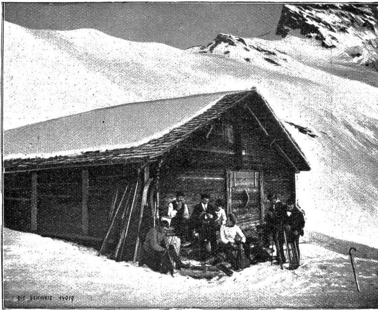
Faulhornbesteigung im Winter: Erster Halt.