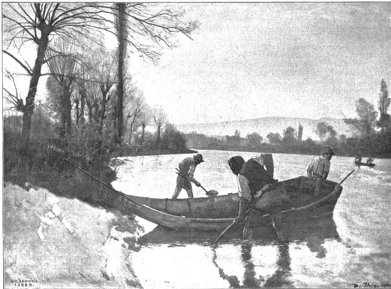
Sandgewinnen in der Arve. Nach dem Gemälde von Daniel Hügli, Genf.

Mathilde bohrte die Blicke in den Schnee, der auf den Steinen lag und schwieg eine Weile, als ob sie nach dem Sinn seiner Worte suchte; auf einmal schreckte