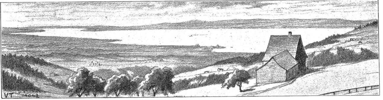
Blick auf den Bodensee (von Bögelslegg aus).

Offen, als er von seinem schwarzen Park gesprochen, schaute ich den tiefen Miß, der durch diese, von einem großen Schmerz gebrochene Seele ging. Die Entmutigung, die Vernichtung dieses hohen Denkens in der quälenden Erinnerung an das Unabänderliche ergriff mich. Wieder strich er sich über die Stirn und fuhr mit sichtlicher Anstrengung fort: