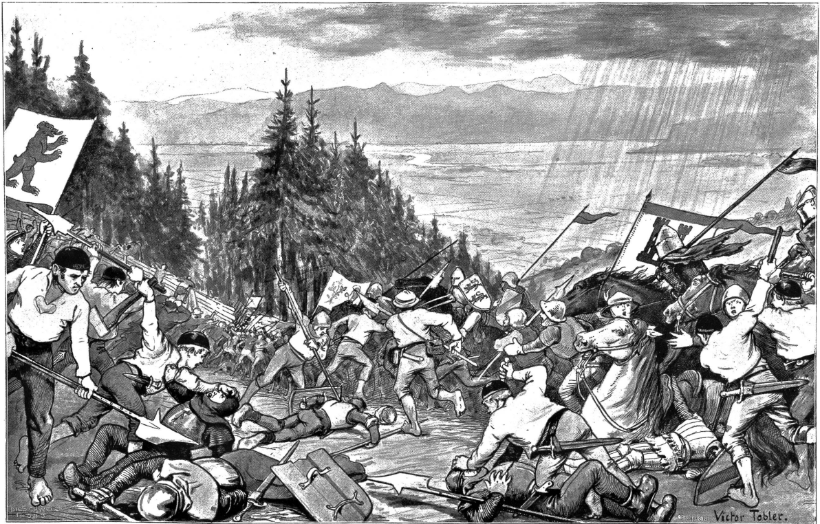
Die Schlacht am Stosß (17. Juni 1405). Nach Originalzeichnung von Victor Tobler, Trogen-München.