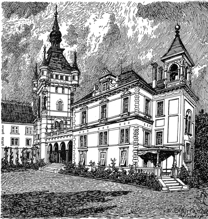
Schlosshof im Schloss Castell bei Konstanz. Federzeichnung von Emanuel Birgy, Basel-München.

Er kann kaum mehr den Pinsel nach Willen lenken; aber er malt und malt den ganzen Morgen, derweil Schmerz und Verzweiflung immer mehr sich in ihm einfrassen. Sie plaudern unausgesetzt, alles Nichtigkeiten; sie zittern beide vor einer verhängnisvollen Pause. Linnell spricht vom Bild und seiner