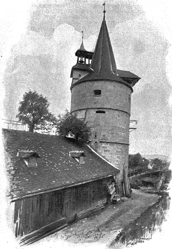
Zug Abb. 5: Schanzengraben mit Kapuzinerturm.

sondern auch diejenigen der Fauna (Volière, Fasanengarten, Hirschpark) ihre wohl eingerichtete Heimstatt haben, ziehen sich am Seeufer entlang. In den schattigen Laubgängen mit unvergleichlichem Ausblick auf See und Gebirge wandelt sich's so gut, daß wir über die Stätte des Unglücks von 1887 fast unversehens hinausgelangen. Hier, an der äußern Schiffslände, empfiehlt es sich, den Blick noch einmal zurückzuwenden. Den Vordergrund füllt ein Stückchen blauer See mit den neuen Quai-Anlagen gar freundlich aus. Es folgen dann die spitzgiebligen Häuser und Türme der Stadt, terrassenförmig an die sanft ansteigende Vorhöhe des Zugerberges gelehnt und überragt von der stattlichen Baumasse der St. Michaels-Pfarrkirche*). Die Illustration „Quai mit Hotel Rigi und Regierungsgebäude“ (auf S. 303) kann uns einigermaßen das Gesagte veranschaulichen. Die Landschaft aber, die herrliche, unvergeßliche muß mit dem Auge geschaut werden! Sie ist entzückend am Morgen, wenn Rigi und Pilatus den ersten Gruß der Sonne empfangen und über See, Matten und Wäldern der zarte Duft des jungen Tages liegt. Nicht minder erfreut sie, wenn vor dem steigenden Tagesgestirn die Schleier zerreißen und an der heitern Pracht der Gestade, an ihrer