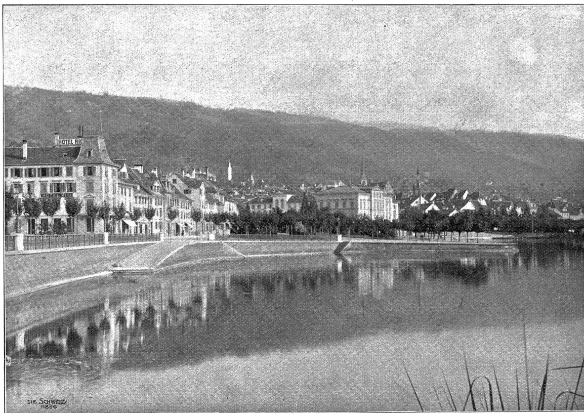
Zug Abb. 7: Quai mit Hotel Rigi und Regierungsgebäude.

„Dieses Zimmer ist verschlossen,“ sagte er im Vorübergehn vor einer Tür mit erklickter Stimme.