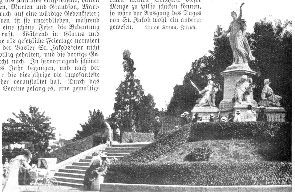
St. Jakobsfest in Basel (26. August 1904). St. Jakobsdenkmal (von Ferd. Schöth) in Basel.

solchen Andrang hatte man noch nie erlebt; es schien, als ob Basel seine ganze Menschenflut auf den Festplatz ergöße. Gegen Abend sind dort wohl mehr als vierzigtausend Menschen beisammen gewesen. Hätte Basel seinerzeit den Eidgenossen nur einen kleinen Bruchteil dieser Menge zu Hilfe schicken können, so wäre der Ausgang des Tages von St. Jakob wohl ein anderer gewesen. Anton Krenn, Zürich.