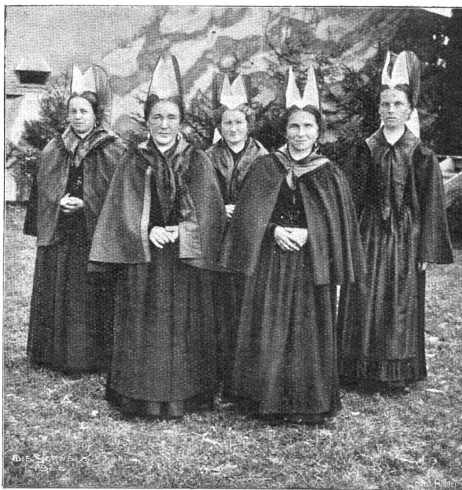
Vom Trachtenfest in Appenzell J.-Rh. Appenzellerfrauen in der Leibtracht („em Stog“).

Dann kam am 7. August „ein Sonntag, hell und klar — es war der schönste Tag im Jahr“. Ueber den Bergen und all den häuserbesäten grünen Hügeln blauer Himmel, in Auen, Dorf und Herzen lachender Sonnenschein! Die Kassierer der Appenzeller- und der Gaiserbahn walteten im Schweiß des Angesichtes ihres einnehmenden Amtes; Völker zu Wagen und Fuß wogten herbei. Dann rauschte drüben jenseits der Sitterbrücke Festmusik; man ließ im „Hecht“, im „Schäfli“, in der „Krone“ und im „Löwen“ die Kaffeelöffel und die Jagdkarten fallen; die schönsten „drii vom Trumpsatz mit de Stöcke“ galten nichts mehr; denn stolz und stramm kam der Trachtenfestzug einhergewallt. Drei Reiter in Uniformen des Schwabentriegezeitalters ritten voran; dann kam ein Stück frühern Landsgemeindelebens zur Darstellung: Landsgemeindeknaben mit Pfeifen und Trommeln, worauf Ratsherren in alter Tracht, den Zweispitz auf den hartlosen Köpfen, Kniehosen am Gangwerkzeug, schwarze Schwalbenschwanzfräcke um den Korpus, möglichst würdevoll