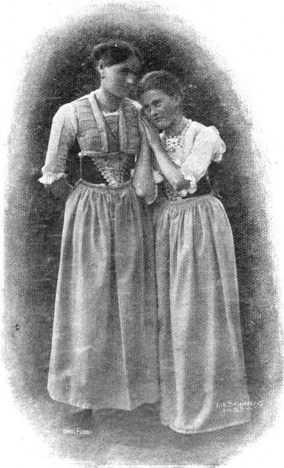
Vom Trachtenfest in Appenzell A.-Rh.

2. Sevel und 3. Düel (moderne Appenzeller Sonntagstracht).