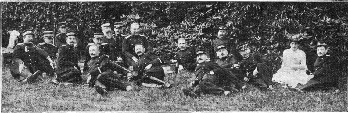
Jahresversammlung der Schweiz. Offiziersgesellschaft in Zug. Bildnickgruppe der Waadtländer Offiziere in Buonas.

Geheimnissen. Den verliebten Pärchen bist du ein guter Onkel geworden, und die Mütter erbitten sich deinen Rat. „Ach, bleiben Sie doch noch,“ sagt dir unbefangen eine schöne Frau; „ich unterhalte mich mit Ihnen besser als mit „so jungen Laffen!“ Und schließlich gewöhnt sich der Mensch auch an diesen Zustand, etwa wie der Hund an die Schläge. „Womit färben Sie denn Ihr Haar? Wie, Sie färben es überhaupt nicht? Ah, ah! Und Sie sind doch schon in dem Alter, wo man . . . hm, hm!“ „Sie tanzen nicht? Recht haben Sie! Das ist nichts mehr für „uns!““ sagt ein alter Bekannter lustigen Angebens. Denn es gibt Leute, die sich gern zu uns Anfängern im Altsein halten, und da der Verkehr mit den Jungen nicht mehr so recht in Fluß kommen will, uns in ihre höhere Altersklasse hinanziehen möchten. „Ja, ja, wir sind halt schon ein paar alte Gesellen!“ „Sind Sie noch immer bei gutem Appetit? Geh'ts noch mit den starken Zigarren? Macht Ihnen der Luftzug keine Beschwerden? Vertragen Sie noch Eisenbahnfahrten? Spüren Sie schon das gewisse Knistern in den Nackenmuskeln, das Krachen des Rückgrates beim Bücken?“ Lächerliche Zumutungen, beschämende Zurücksetzung, ungebetene Schonung! Ich mache mich erbötig, die höchste Vergesspizze zu erklettern, ohne außer Atem zu kommen, ja, mich nächstens wieder zu — verheiraten.