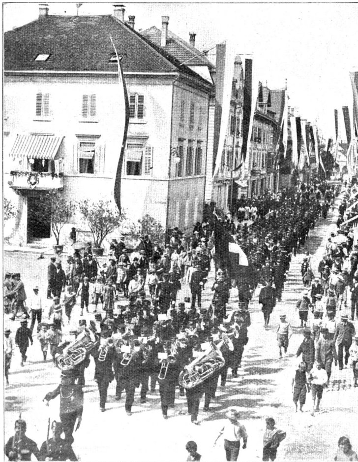
Jahresversammlung der Schweiz. Offiziersgesellschaft in Zug (13. — 15. Aug. 1904). Eingang der Gldg. (Schw. Schot. H. Gran, Zug).

Alt bin ich also — wirklich und wahrhaftig alt? Ich fühle zwar noch nichts davon; aber andere lassen mich's fühlen. So wäre denn der Grenzhügel erreicht, der unser Leben entzweitelt, gleichwie das Jahr entzweigesehieden ist: die erste Hälfte Spritzen und Grünen, Blüte und Duft, die zweite Blätterfall und Frost. Fortan ist jeder Tag nur mehr eine Gnadenfrist, jeder Sonnenblick ein Geschenk, jede Blume am Wegrand ein Almosen. Die jungen Frauen vertrauen dir heikle Aufträge an, die jungen Mädchen plaudern in deiner Gegenwart ohne Scheu und Rückhalt von ihren kleinen