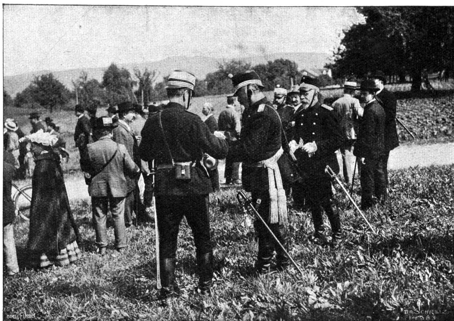
Manöver 1904. Bundesrat Müller im Manövergelände (Phot. Ph. & C. Lutz, Zürich).

In der Abteilung der Aquarelle begegnet man mit besonderem Vergnügen den Originalien zu Kreidolfs reizvoll schalkhaften Blumenmärchen und Wiesenzwergen. In Verbindung mit diesen frischen poetischen Schöpfungen möchte man Martin Schönbergers (Zürich) allerliebste Gemälde: „Der Frühling ist da!“ nennen, wo ein ganz einfaches Motiv (ein lachendes, nacktes Kind im Freien mit einem Früchtekranz) durch das leuchtende Kolorit zu einer wahrhaft festlich-fröhlichen Wirkung gesteigert ist. Ein Genrebild im besten Sinne des Wortes ist Théodore Delachaux' kleines malerisch delikates Gemälde Tré-