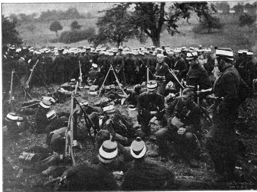
Manöver 1904. Lagerleben.