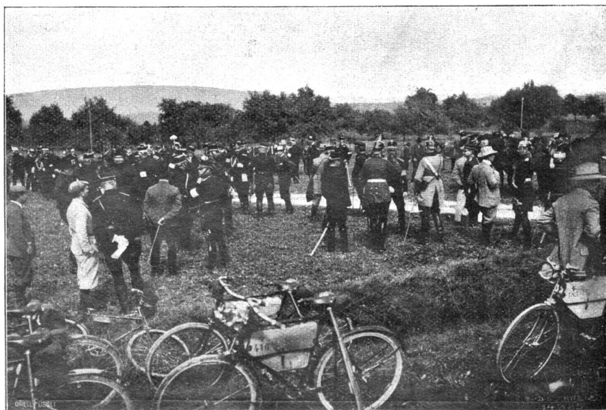
Manöver 1904. Die fremden Offiziere vor der Kritik (Phot. Ph. &amp; C. Vint, Zürich).

Wenn ein bekannter Monarch auf die Kunst seines Landes persönlichen Einfluß üben und so die großen Mäcene der Renaissance kopieren will, vergißt er etwas sehr Wichtiges, nämlich, daß jene das Gottesgnadentum des Künstlers über das ihre setzten, daß sie den Herrscher vergaßen und nur insofern ein Anrecht auf den Meister zu haben glaubten, als sie selbst künstlerische Menschen waren.