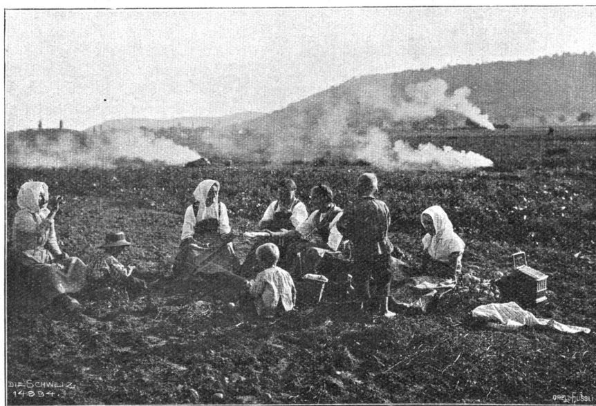
Bei Ruppertswil.