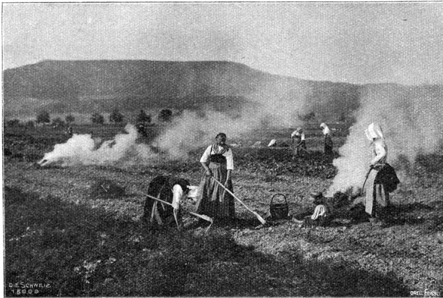
Kartoffelernte (bei Rapperswil, St. Margau).

Die ganze Woche über führte sie mit ihren zarten Händen fleißig die Nadel. Aber am Sonntag ging sie, wenn es die Jahreszeit irgend erlaubte, mit mir in den Wald. Sie lehrte mich, daß jeder Baum, jeder Strauch, jede Blume ein lebendiges Wesen sei. Sie kannte die Sprache der Vögel und nannte alle mit Namen. „Halte dich nie an einen Menschen, der den Wald nicht lieben kann,“ sagte sie; „das wäre dir nicht gut.“