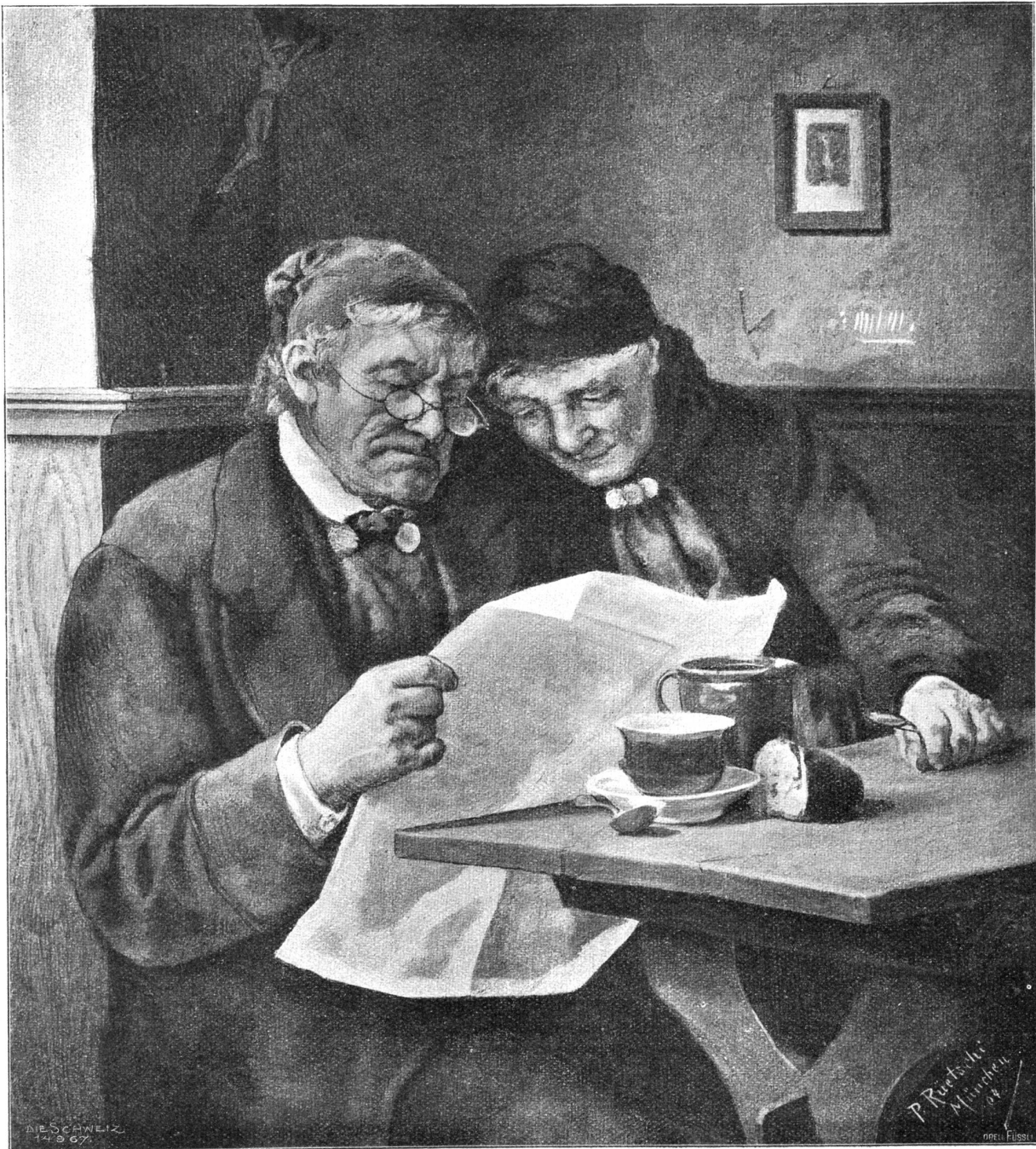
Am Sonntagmorgen. Nach dem Gemälde von Paul Rietschi, Suhr-München.

und das mir allein von allen im Gedächtnis geblieben ist, hieß: