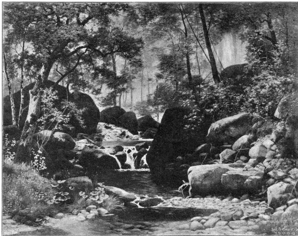
Waldlandschaft (Kaltbrunnthal). Nach dem Gemälde von Jacob Lorenz Mübisühli, Basel.

Zum ersten Mal in seinem Leben hatte er unter einem