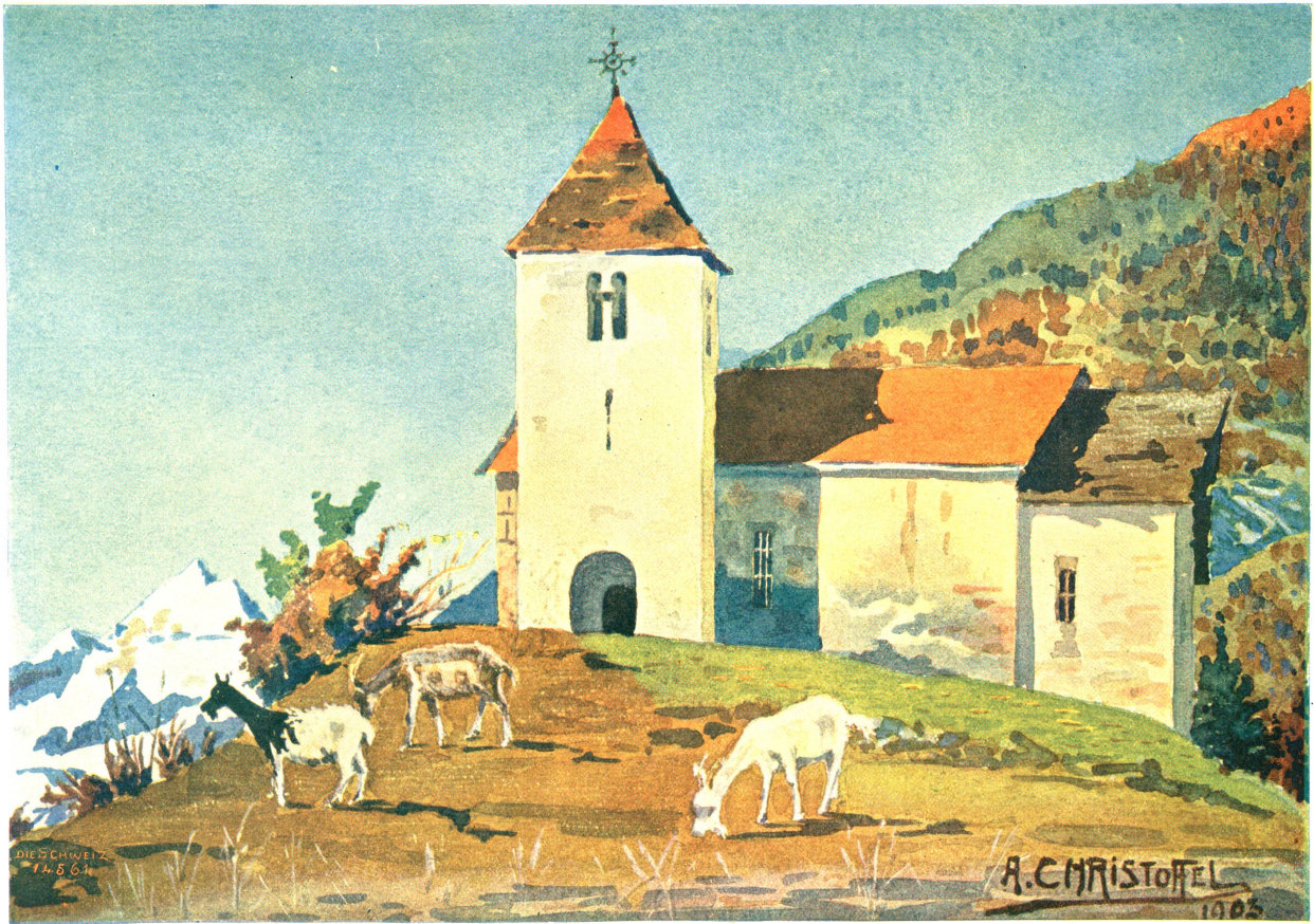
St. Lorenzkapelle im Domleschg (Kt. Graubünden). Nach einem Aquarell von Anton Christoffel, Sants (Oberengadin).