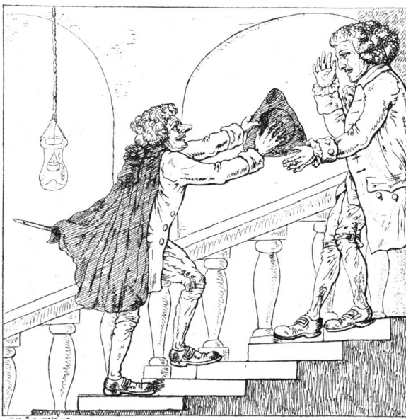
Zweyte Position auf der Treppe

Client: Nein doch, bey Liebe nicht! Ich laß es nicht geschehen! Patron: Ich werde ganz gewiß hinab mit Ihnen geben.