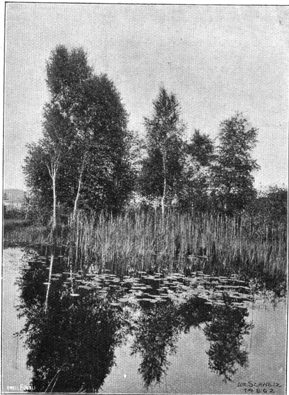
Am Katzensee bei Zürich.

Und es floh mich plötzlich die Gesittung Des erwachs'nen und gesehten Menschen: Wieder kroch ich da auf allen Vieren Durch das Dickicht wuchernden Gestrüppes, Und die Dornen ritzten meine Hände. Doch — schon sah ich eine helle Lichtung, Und ich stand mit einem Mal in meinem Jugendparadiese, auf dem weichen Rasenteppich, selig, wie ein Junge,