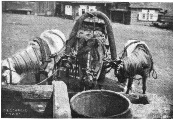
Carantass (Troika) in einer Poststation.

Auf größeren Reisen werden die Pferde von Zeit zu Zeit gewechselt an Poststationen, auf denen oft große Pferdeherden gehalten werden. Reisen wenig Leute, so kommt es vor, daß ein Pferd wochenlang nicht gebraucht wird und bei dem freien Leben in der Steppe halb verwildert. Dann bietet das Anschirren und Fahren Schwierigkeit. Vor jedem der angespannten Tiere muß ein Mann stehen; ist alles bereit, sind Reisende und Kutscher aufgelesen, so springen die Wärtter vorn vor den Pferden auf ein Zeichen weg, und die losgelassenen Tiere rennen unaufhaltsam in der Richtung, in der der Wagen gerade stand bei der Abfahrt. So gelangt man bisweilen auf unliebame Abwege.