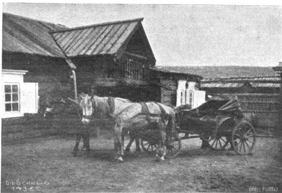
Carantass (Troika) in einer Poststation.

Die Fortsetzung der Fahrt bei Nacht bot nun allerlei Schwierigkeiten. Gegen zehn Uhr gelangten wir an die Stelle, wo die russische Kolonisation aufhört und die Reservationen der Mongolen beginnen. Um ein loderndes Feuer kauerten