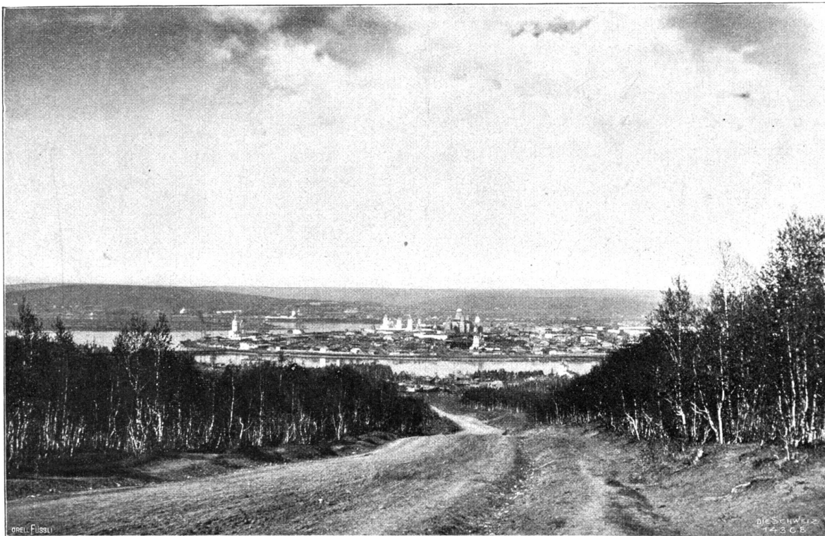
Irkutsk mit der Angara, von Süden.