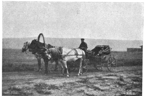
Carantass (Troika) auf dem sibirischen Trakt.

Nach wenigen Stunden Raft ging es weiter, tiefer in dürre, öde, graurote Steppe hinein. Kable Hügelzüge treten hervor, sich zu dem Tal zusammenschließend, in dem der heilige Berg