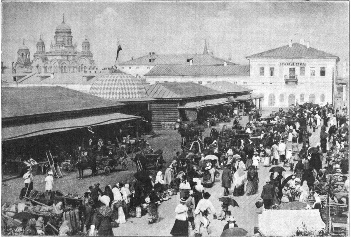
Irkutsk: Marktstraße, im Hintergrund die Kathedrale.

kann, was überhaupt denkbar ist — ähnlich wie in den großen Warenhäusern der europäischen und amerikanischen Großstädte. Es wäre unmöglich, daß selbst in den größeren Städten mehrere derartige Geschäfte existierten, würden nicht die Ladenhüter ihren Weg in ähnliche Filialen der kleinern Städte und von da in die Dörfer finden, während der Rest schließlich an Lohnes Statt an die Minenarbeiter und Chinesen gelangt.