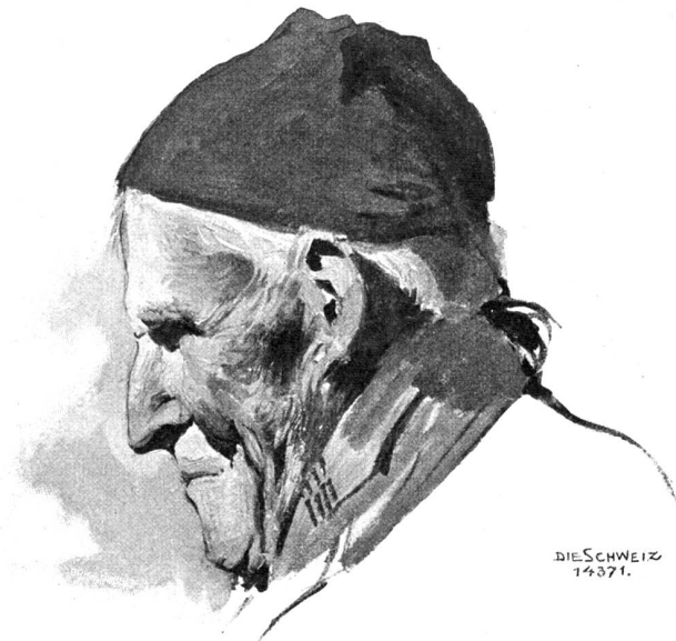
Delphi aus einem Skizzenbuch von J. Kuch, Schwanden-Paris.