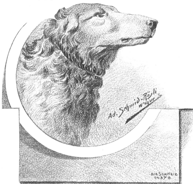
Russischer Windhund. Nach Zeichnung von Ad. Schmid-Rösch, Winterthur.

In ihrem Zimmerchen war es bitterkalt; aber sie öffnete trotzdem noch einmal das Fenster und sah hinaus. Es war eine helle, weiße Nacht; die Drähte, die dicht über ihrem Kopf vom Dach des Hauses nach dem Mast auf dem Siebel des Hotels „Zur Traube“ hinüberliefen, glitzerten. Der Wind hatte sich gelegt. Ueber dem Rhein aber stand eine silberweiße, unbewegliche Nebelschicht, nicht höher als ihr Fenster, sodaß sie darüber hinweg die Höhen des andern Ufers und die Lichter im Fort sehen konnte. Auf der Flut aber lag's mauerndicht. Weder der Zug des Stromes, noch das Geräusch der drüben im Talbahnhof rängierenden Güterzüge drangen zu ihr.