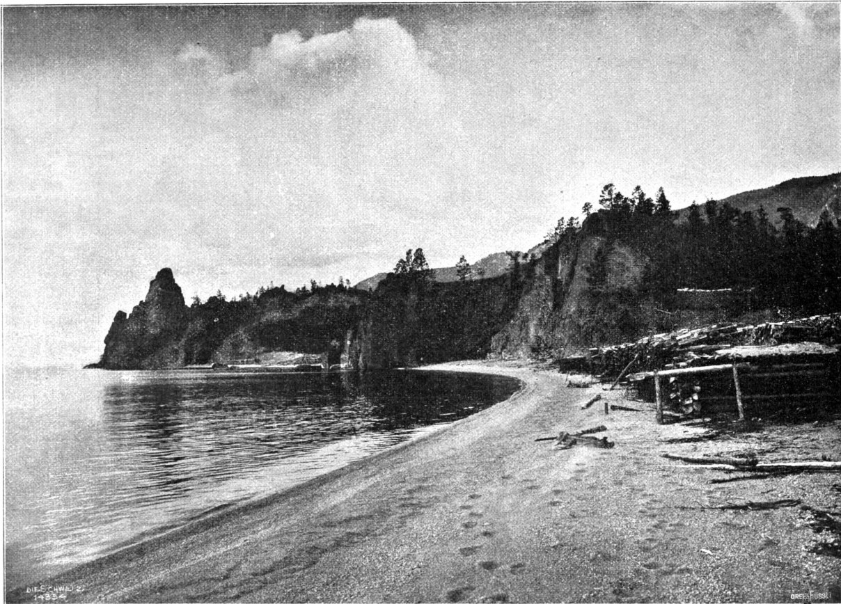
Am Ufer des Baikalsees.