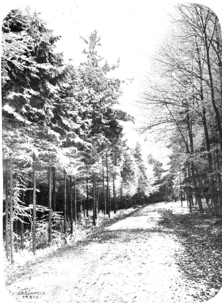
Waldweg im Winter.

Die Doktorin war in nervöser Unruhe aufgestanden und hatte bald diesen, bald jenen Gegenstand in die Hand genommen und zurechtgerückt, und Agathe fühlte, daß ihr die Zeit kostbar wurde. Sie empfahl sich und verließ das Haus ungetröstet, um viele Hoffnung ärmer, kaum darauf hörend, daß ihr die Doktorin noch anerbote, die Sache in ihrem Frauenverein zur Sprache zu bringen. Diese schaute dem Mädchen noch aus dem Fenster nach, wie es schleppenden Ganges, als wüßte es nicht recht wohin, die Straße entlang zog. Hätte sie mehr für das Mädchen tun sollen? Sie ward unsicher von Mißtrauen und Mitgefühl geschaukelt und seufzte, daß die vielen schlimmen Erfahrungen des Lebens einem doch so hinderlich würden am Entschluß zur Teilnahme. Am besten war es, sich noch mit einigen Frauen zu beraten und sich danach ein Urtheil zu bilden. Und sie war verstimmt, daß ihr mitten in ihre Nageschäfte diese unbequeme Frage gekommen; auch fühlte sie sich nicht ganz behaglich in ihrem Gewissen und machte gleich einen Kompromiß, das nächste Mal ohne