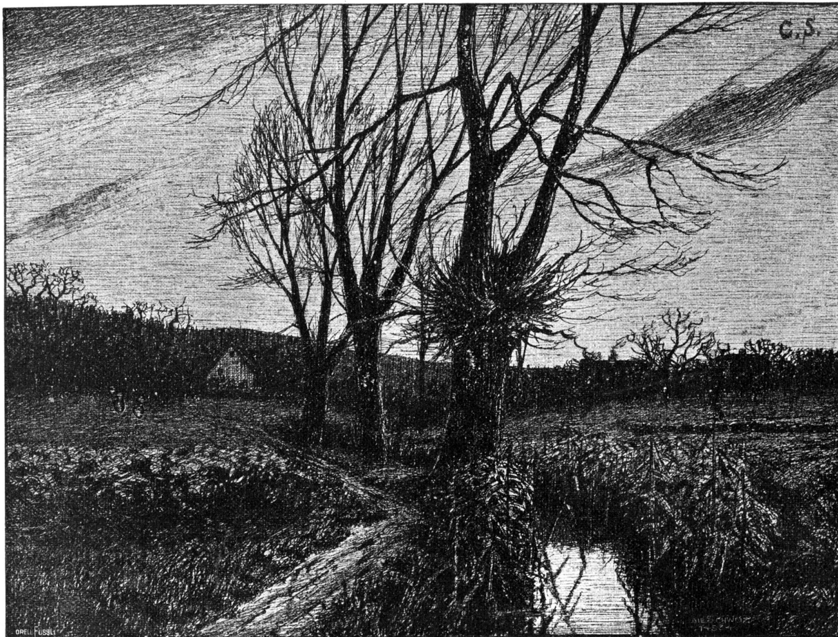
Abend. Nach Federzeichnung von Karl Sailer, Zürich.

befasse, und das darauf erfolgende Ausbleiben weiterer Korrespondenzen beunruhigte den gewissenhaften Geschäftsvertreter aufs höchste. Rasch entschlossen hatte er seinen Kurs geändert und mit Einsicht und Glück für sich und sein Mustermaterial auf einem durch Kriegsflagge privilegierten Fuhrwerk dadurch Raum gewonnen, daß er sich dem Landesunkundigen auf alle Weise nützlich erwies.