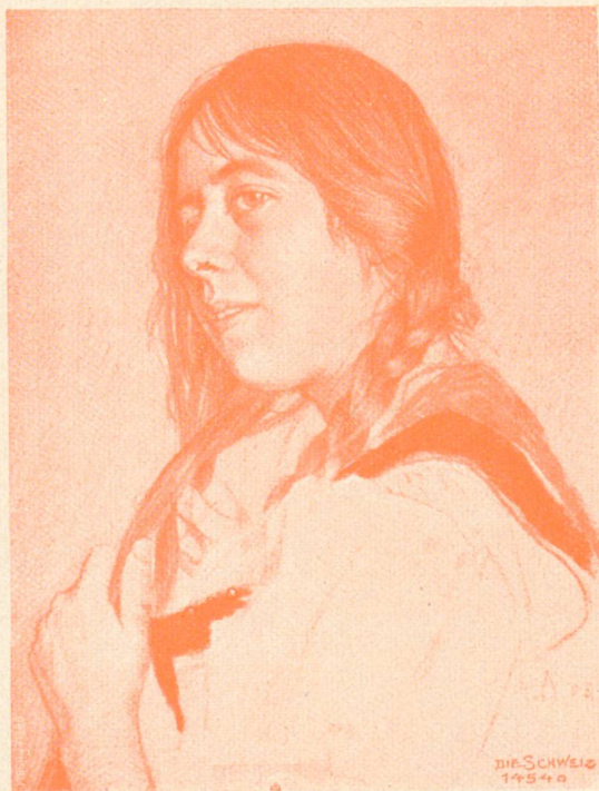
Toilette. Nach einer Aedelzeichnung von Hans Diegel, Bern.