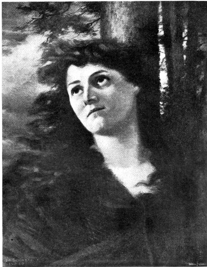
Herbstklage (nach Renan). Nach dem Gemälde von Eduard Ribisühti, Basel.