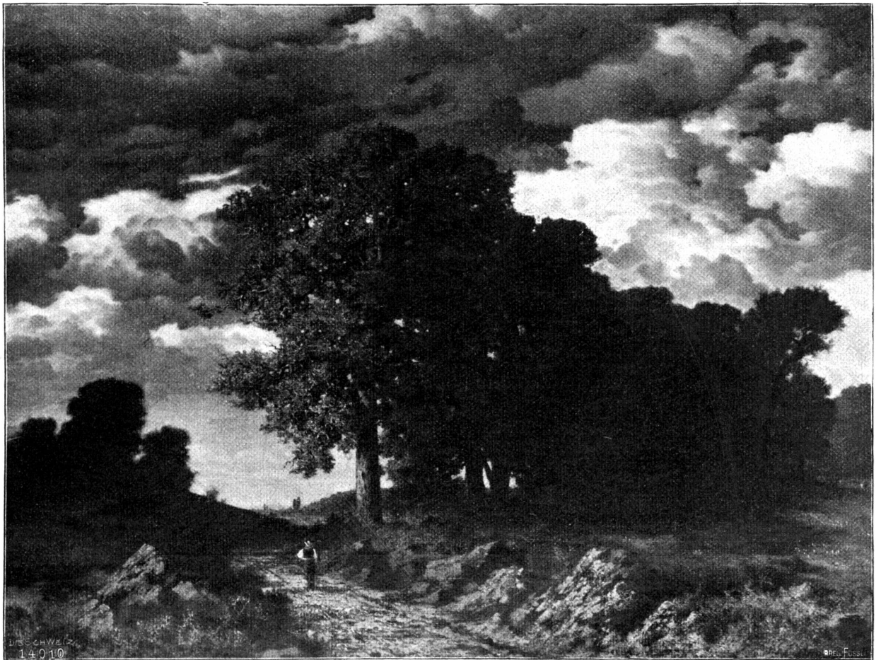
Gewitter im Anzug. Nach dem Gemälde von Eduard Rüdisühli, Basel.