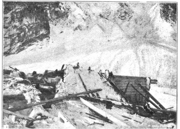
Lawinsturz im Haslital. Vom Luftdruck zerstörte Scheune in der „Schwendli“.

Garzafef. Die Frau ist eine Russin der Beaumonde: sie will nicht in der Steppe und im Zelt wohnen. Aber Garzafef liebt sein Zelt und sein Volk. Er lebt in seiner Kibitka, besucht sein Haus und seine Familie in der Stadt. Seine Tochter ist halb erwachsen. Ihre Züge sind ganz diejenigen des Vaters: typisch kalmlückisch. Dort reiten sechs Reiter in eleganter, tscherkessischer Tracht, mit Burka und Gürtel, die schwarzen Pelzmützen aus der olivbraunen Stirne zurückgeschoben. Sie sitzen hoch auf dem Rücken der Pferde im engen, hohen, kaukasischen Sattel. Die blanken Kinschale funkeln in der Sonne. Sie sind nicht „Dschigiten“ mit zerlumpten Kleidern, aber vorzüglichen Waffen und kostbaren Pferden. Nein, bei ihnen ist alles komplett. Sie sehen aus wie Fürsten und Herrscher von männlicher, phantastischer Schönheit, die herablassend sich am Fest ihres Volkes zeigen und es ehren, indem sie in feinsten Gala aufreten. Ihre Pferde sind klein und wie Hirsche gebaut, aber stark und geschmeidig wie Panther. Mit aufgerissenen Nüstern und spähenden Augen und Ohren bewegen sich diese Tiere in trippelndem, schnellem Trab oder in energischem und doch graziosem Galopp. Ueber den Hinterteil des Tieres, ihn bedeckend, hängt die weite Burka aus schwarzem, langhaarigem Filz; Sattel, Zaum, Gebiß und Bügel sind prunklos;