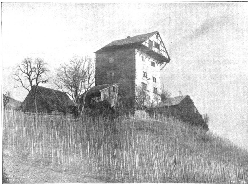
Burg Neu-Altstätten im Rheintal (Phot. C. Baer, Altstätten).

„Wohl habet Ihr mich gesehen,“ erwiderte Hildebrant;