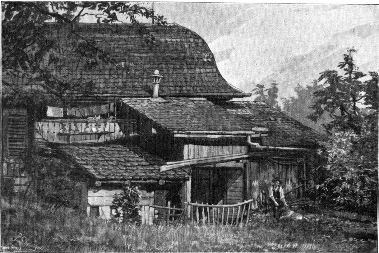
Altes Haus an der Eidmattstrasse in Zürich. Nach einem Temperabild von Pedro Schmiegelow, Zürich.

lagen auf Eis stelle. Unter uns, ich war nahe daran, mich in ein Idyll zu verträumen. Es gibt ja im Menschenleben Augenblicke, wo man dem Weltgeist ‚ferner ist‘ als sonst und wo man auf die ganze Philharmonie verzichtet für den Genuß von Schweizerkäse mit Kuhglockenbegleitung. Aber in der zwölften Stunde addierte ich: Nichts zu nichts gibt nichts. Darum schwieg ich auf Ihre Briefe. Vielleicht tat ich Ihnen weh; aber es war das einzig Vernünftige so, nicht wahr? Nun habe ich mich verheiratet unter der Devise: ‚Mon ami, pas d'échauffement, je vous en prie!‘ Wenn man statt der Milton nur die dazu gehörigen Präzisionen besitzt, darf man sich nicht lange überlegen, ob sich Maifühle und späte Johannistriebe vertragen. Bah, das verstehen Sie nicht! Sie wärmen sich an Ihren Schulmeisteridealen und sprechen Ihr ‚Gerichtet‘ über mich und meine Art. Meine Welt aber schreit: ‚Selig, selig, selig!‘ Ob ich's bin? Sagt's mein Blick auf dem Bild? Ach, die Gefilde der Seligen... Ein jeder Mensch hat sein Garteneckchen drin... Aber wo blüht die blaue Blume? Bei Dir, Du Freund, im flachen Land. Hier oben bei uns weht's kühl, da wagt sie sich kaum über die Erde, und tut sie's einmal arglos, dann kommt der Nord, der auch Vernunft heißt, und sagt: Geh unter die Erd' und mach die blauen Augen zu; denn, was du schauen wirst, macht sie dir trüb... Lebe wohl...“