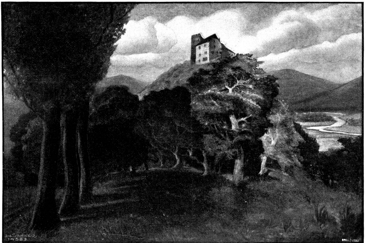
Die Habsburg. Plakatentwurf in Tempera von Pedro Schmiegelow, Zürich.

Er erwartete nicht seine Blut von ihr und meinte arglos, es müsse ihr sein wie den schneenumgürteten Firnen. Und doch suchte er nach einer halben Zärtlichkeit, die zwischen den Zeilen liegen konnte, und bettelte darum. In seinem Traum lag er ihr zu Füßen und flehte: „Küsse mich einmal nur und mache mich zum Gott für einen Herzschlag!“